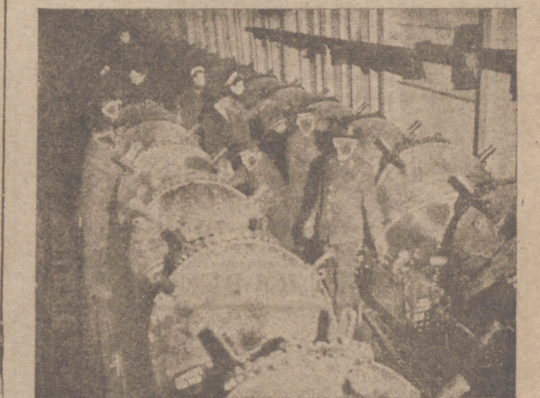
Una doble fila de minas montadas sobre carriles para ser transportadas a su destino.

Londres, 22.—El Ministerio de la Guerra publica el siguiente comunicado: