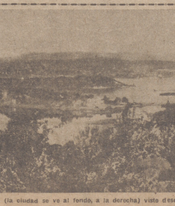
El fiord de Oslo (la ciudad se ve al fondo, a la derecha) visto desde las alturas de Bekkolaget

Roma, 21.—Con motivo de la Fiesta del Trabajo italiano y de la fundación de Roma, el director del «Telégrafo», Ansaldo,