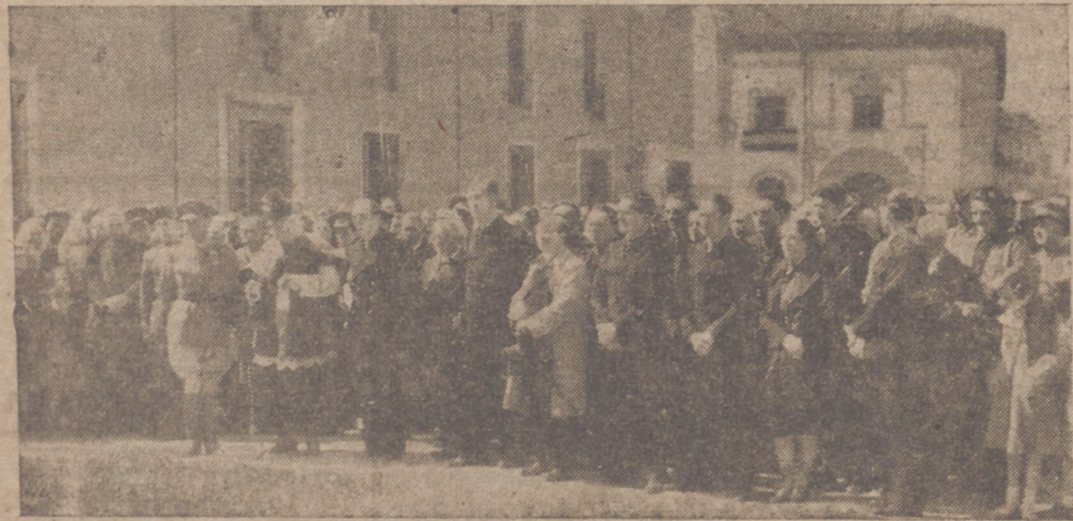
Las autoridades que presidieron el acto