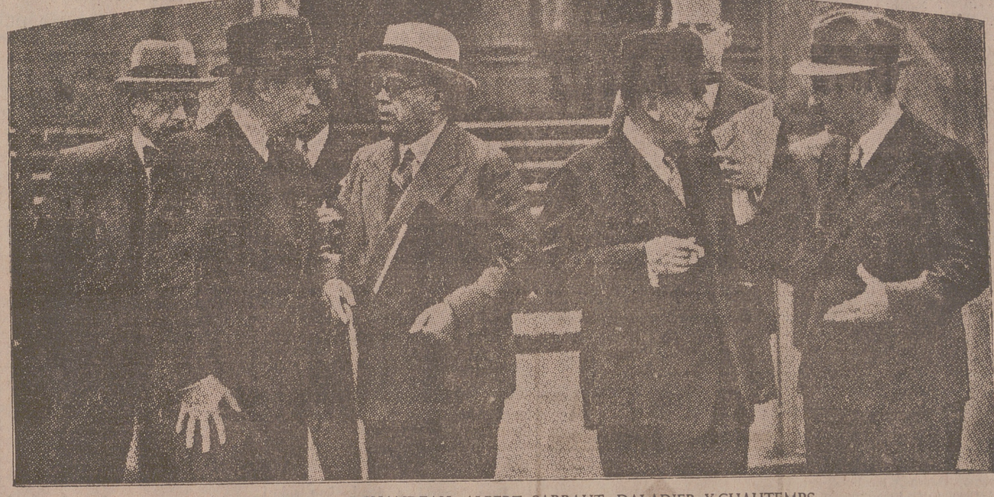
MM. GENTIN, MARCHANDEAU, ALBERT SARRAUT, DALADIER Y CHAUTEMPS