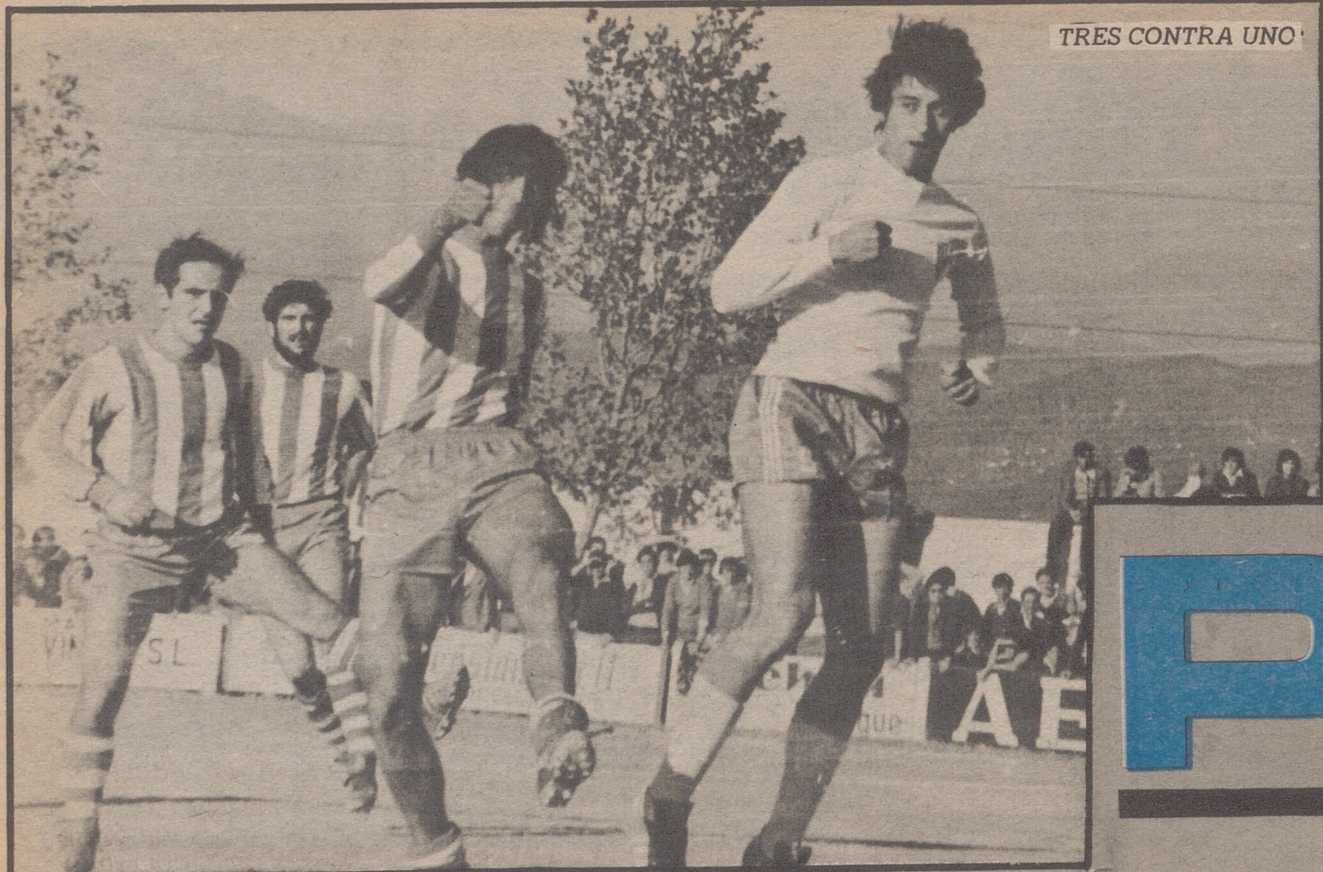
TRES CONTRA UNO