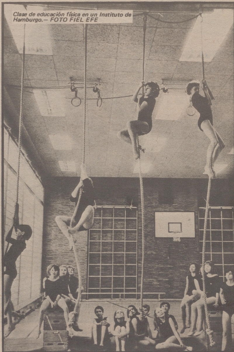
Clase de educación física en un Instituto de Hamburgo.