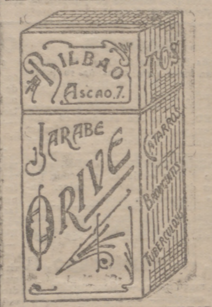
EL MEJOR remedio para EL PEOR catarro, Jarabe Orive. Precio, 4/25 ptas