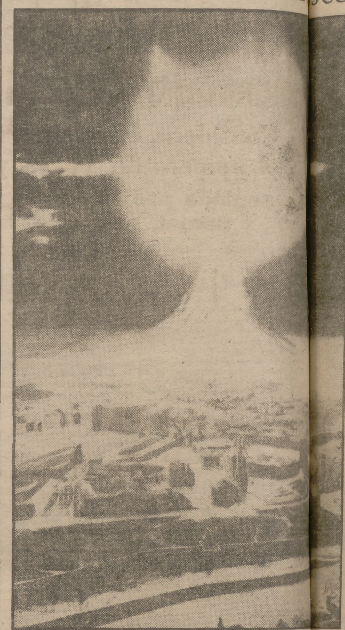
La revista americana "Collier's" ha publicado este dibujo, de la explosión de una bomba atómica sobre Moscú.