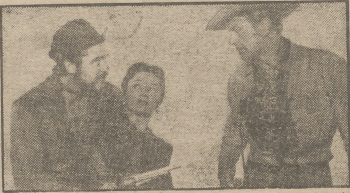
Gary Cooper, Ruth Roman y Steve Cochran en una emocionante escena de "Dallas, ciudad fronteriza", que pronto se estrenará en Madrid.

la Gran Vía, asistimos a una de las múltiples aventuras ocurridas en el turbulento territorio. Es la historia de un ex coronel confederado que llega a la ciudad en busca de los tres hombres que incendiaron su hogar