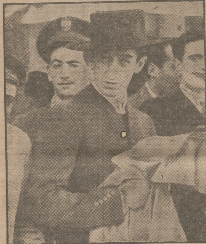
Manolete, preparado para actuar en un festival benéfico.

Manolete no redondea las tardes a su gusto ni en la corrida de la Prensa ni hasta mediados de mes en Murcia. El clima le-