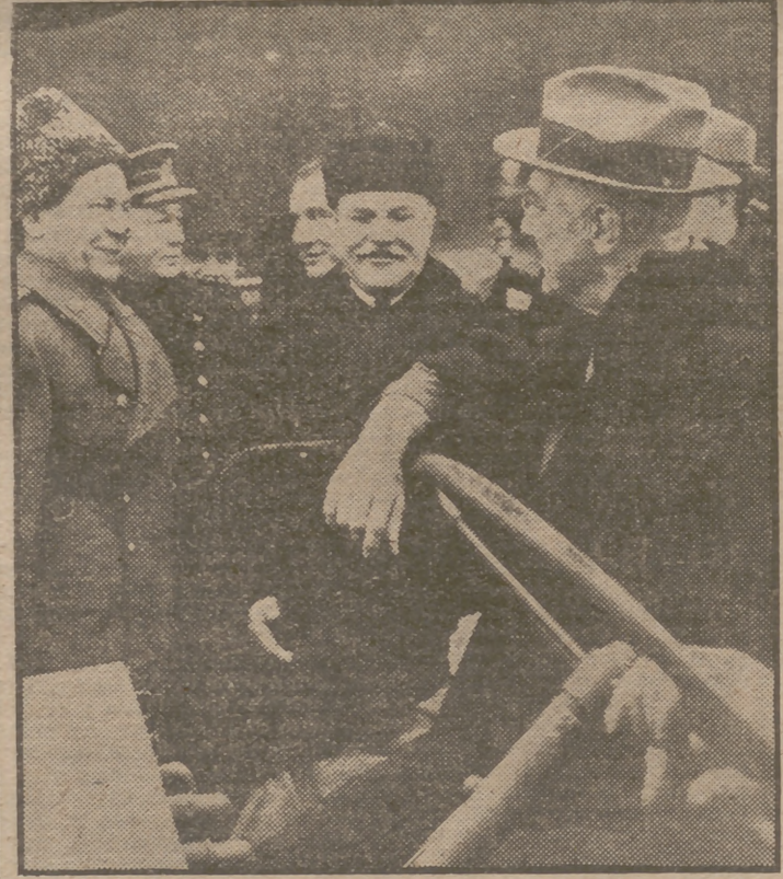
El Presidente Roosevelt (derecha), hablando con un oficial del Ejército ruso durante su visita a Rusia para la Conferencia de Yalta. En el centro, el ministro de Relaciones Exteriores soviético, Molotov.

antes de que dejáramos Washington él había dicho a un grupo de senadores que si Stalin proponía que se otorgara la calidad de miembros de las Naciones Unidas a la Rusia Blanca y la Ucrania, él insistiría en que se reconociera igual categoría a cada uno de los cuarenta y ocho Estados de la Unión Norteamericana. La verdad es que las Repúblicas Soviéticas no son más independientes que éstos. Le recordé también con qué efectividad los oponentes de la Liga de Naciones habían argumentado que los ingleses, por razón de sus dominios, tendrían cinco votos en la Asamblea, en tanto que nosotros sólo tendríamos uno. Nuestro pueblo había llegado a darse cuenta de que los dominios eran Estados independientes y frecuentemente tenían puntos de vista diferentes que los del Reino Unido; pero esto no era igualmente cierto en cuanto a las Repúblicas Soviéticas. Yo temía que los adversarios de las Naciones Unidas pudieran utilizar la concesión de tres votos a la Unión Soviética tan efectivamente como los enemigos de la Liga de Naciones habían usado el argumento de los votos británicos veintiséis años atrás. Solicité al Presiden-