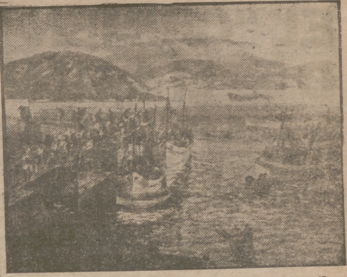
"El muelle de Estribela" (Pontevedra), uno de los magníficos cuadros que J. J. Rochelt presenta en Pereantón.

Importante Empresa desea relacionarse con señores viajeros de comercio, preferentemente del ramo de Papelería, para asunto fácil, compatible e interesante. Deben escribir indicando zona en que trabajan. Inútil sin referencias. Apartado de Correos 517, Madrid.