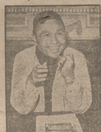
Thakin Nu acaba de firmar en Londres el documento por el que Inglaterra concede la independencia a Birmania. Y vean ustedes qué contento se ha puesto el primer ministro. Su sonrisa parece más bien de sorpresa, como la del que consigue una cosa que no esperaba.