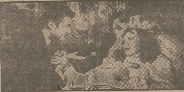
Susanna Foster, la bellísima actriz y excelente cantante, junto al apuesto galán Turhan Bey, en una escena de "Misterio en la Opera", formidable film en technicolor que hoy se estrena en el suntuoso Coliseum.

PUEBLO ha organizado su II CONCURSO ANUAL DE CINEMATOGRAFIA