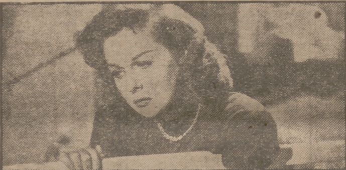
Susan Hayward en un primer plano de "Una mujer destruida", la formidable superproducción de la Universal que muy pronto se estrenará en Madrid.

Acto seguido se procedió al reparto de premios, recogidos los, por su trabajo en las distintas ramas de la producción premiada, representantes de cada película, entre grandes ovaciones del público.