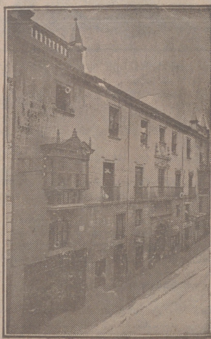
Fachada, por la calle de Santander, 10, 12 y 14, de la CASA SOCIAL propiedad de la Federación Burgalesa de Sindicatos Agrícolas Católicos.

Oficinas: (Casa de la Federación): Calle de Santander, 10 y 12 Burgos