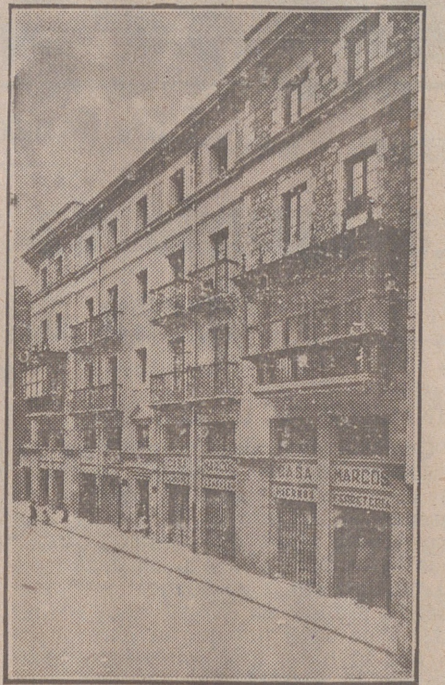
Fachada, por la calle de la Moneda, números 15 y 17, de la CASA SOCIAL propiedad de la Federación Burgalesa de Sindicatos Agrícolas Católicos.

No confundirse: Calle de Santander, (Casa de la Federación) - Burgos