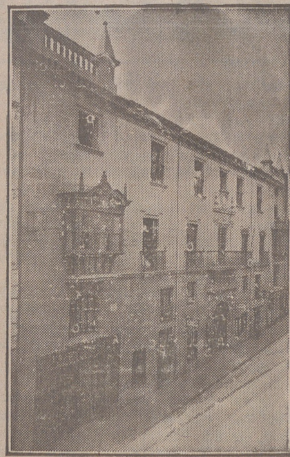
Fachada, por la calle de Santander, 10, 12 y 14, de la CASA SOCIAL propiedad de la Federación Burgalesa de Sindicatos Agrícolas Católicos.

En ella están las Oficinas de la FEDERACION, CAJA DE AHORROS, MUTUALIDAD AGRICOLA BURGALESA y Redacción y Administración de «El Castellano» y «El Defensor de los Labradores»