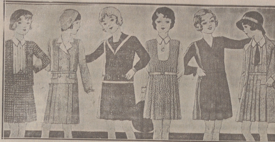
Vestiditos de lana, crepón seda y punto lana, edad de 8 a 14 años, a 14, 16, 18, 20 y 25 pesetas.

Casa Munguía Plaza Mayor, 42 y Lala Calvo 9 Sucursal: Plaza Mayor, 5 BURGOS Primera casa en confecciones para caballero, señora, jóvenes y niños. — Tejidos, Pañería y Sastrería.