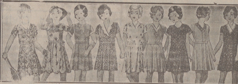
Vestiditos niñas edad de 5 a 10 años, en lana, crepón o punto a 10, 12, 15, 16, 18 y 20 pesetas.

USTED CONSEGUIRÁ TOMAR UN BUEN PIDIENDO EL DE ESTA MARCA: