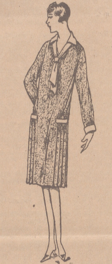
Vestidos de crepón, seda y en lana, colores novedad, a 20, 25, 50 y 40 ptas