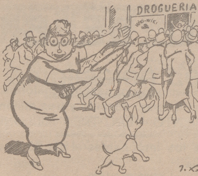
DOÑA COLORINA.—¿Green ustedes que en esa droguería regalan duros? ¡Pues mucho más! ¡Venden los afamados Tintes domésticos WIKII!

Se comprende que la gente se esfuere por adquirirlos. Con su uso todo parece nuevo. Medias, je seys, vestidos, blusas, pedras de caballero, adquieren la apariencia de recién salidos de la tienda. Fija en las droguerías esta marca y no tome otra si quiere obtener resultados excelentes. Cada sobre lleva la manera de usarlo.