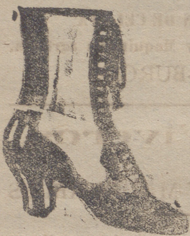
Gran surtido en todas clases, y sección económica a precios de fábrica.

En la Delegación del Comité del Nitrato de Sosa de Chile, Almirante 19, Madrid, se resuelven gratuitamente las consultas relativas a la aplicación de este abono, que se hagan por carta ó verbalmente, y se envían folletos que tratan de la fertilización de los diversos cultivos que pueden interesar al agricultor español.