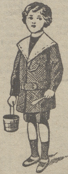
50 modelos diferentes en trajecitos de niños en paño gerga y pana.

:- Guardapolvos de caballero, señora y niños :-