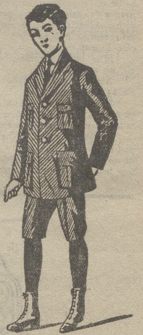
Trajes de jovencitos forma export y corriente en paño, pana y dril.

- - La casa que más surtido presenta - -