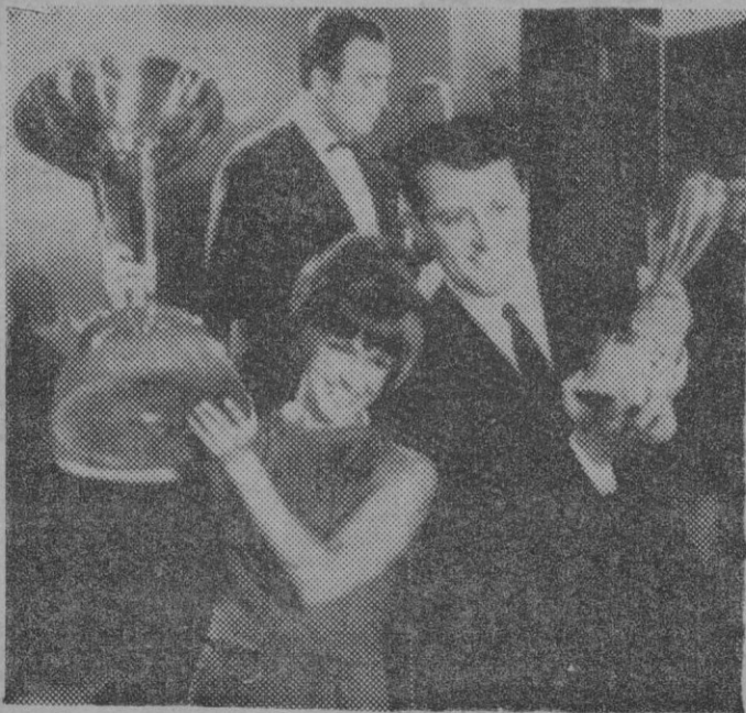
Esta es la pareja de intérpretes de la canción ganadora, con los trofeos conquistados.

He comprendido que te amo cuando he visto que bastaba un retrato tuyo para ver desvanecerse en mí la indiferencia y temer que no volviésemos más.