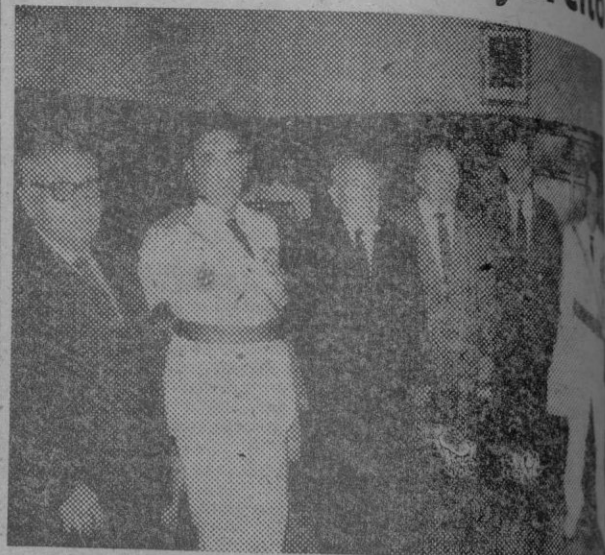
Los tres homenajeados junto con los generales Cabrero y Mendoza y el coronel Lassaia, después del acto.

de ayer en uno de los edificios que ocupa el Gobierno Militar, tuvo lugar un emotivo acto de homenaje tributado por el Excmo. Sr. Ministro del Ejército, a través del Gobernador Militar, a tres retirados en los que concurrieron meritorias circunstancias.