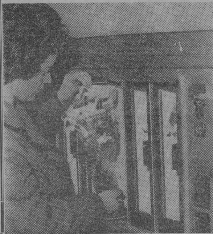
EN VIENA SE HA GENERALIZADO LA INSTALACION DE APARATOS AUTOMATICOS EN LOS QUE PUEDEN ADQUIRIRSE PEQUEÑOS RAMOS DE FLORES. COMO EXPLICA ESTA SEÑORITA, YA NO HAY NECESIDAD DE ACUDIR A LA FLORISTERIA Y PUEDE ADQUIRIR EL RAMO AL MOMENTO