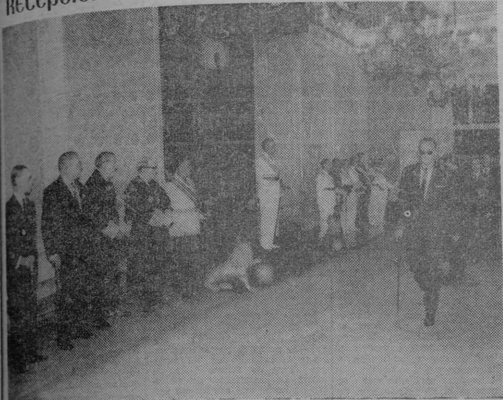
IMAGEN DE LA SOLEMNE RECEPCION, CELEBRADA AYER, CON MOTIVO DEL «DIA DEL CAUDILLO», EN EL SALON DEL TRONO EN LA CAPITANIA GENERAL DE BALEARES. EN PAGINAS INTERIORES DAMOS LA RESEÑA DE LA RECEPCION.

El diario de más circulación en el Archipiélago