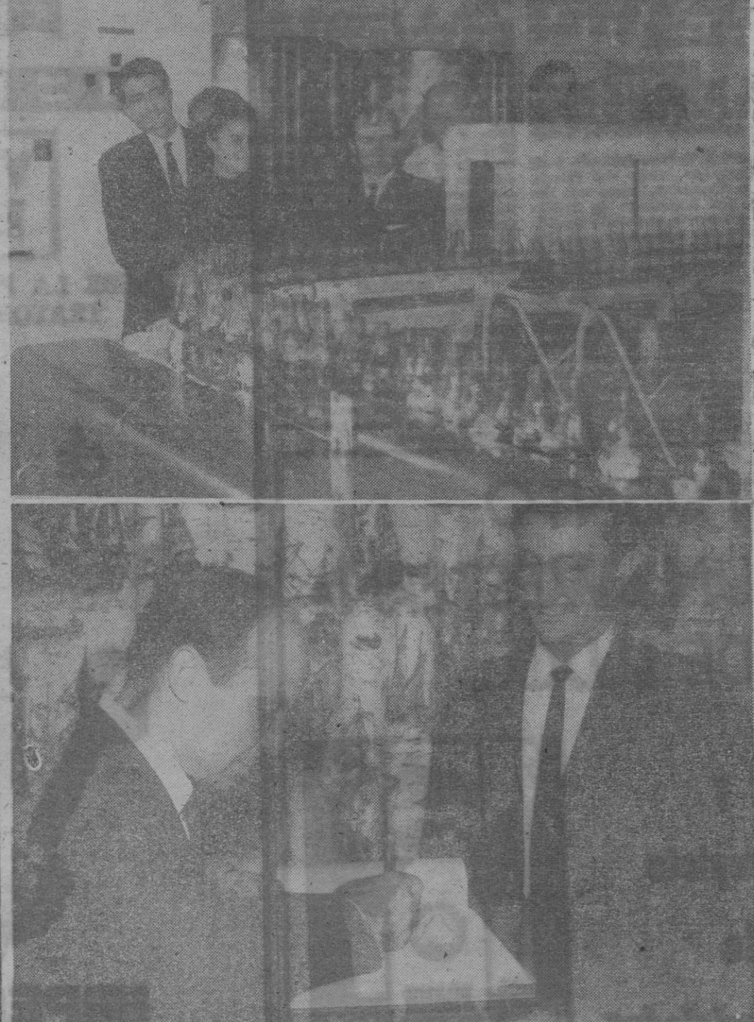
Ayer el pentacampeón del Mundo de ciclismo tras moto, Guillermo Timoner, tuvo la deferencia de visitar la planta embotelladora de los concesionarios de Coca-Cola...

Al visitar el Pentacampeón su planta embotelladora