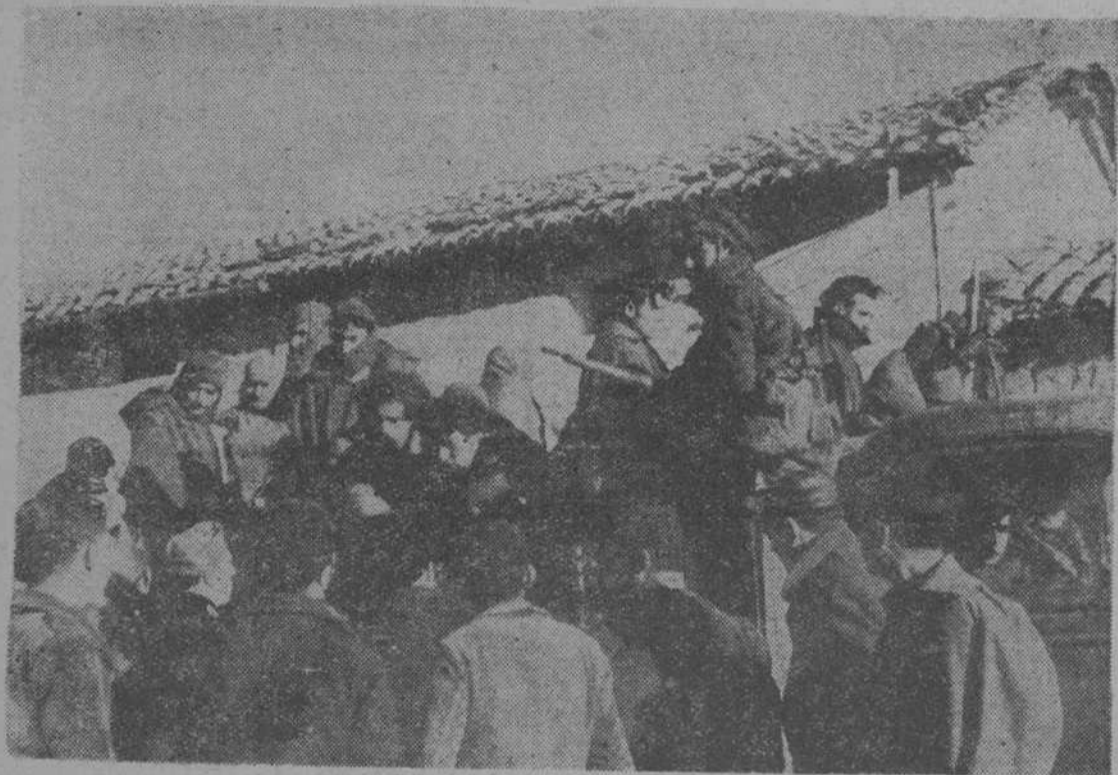
Un camión, con prisioneros