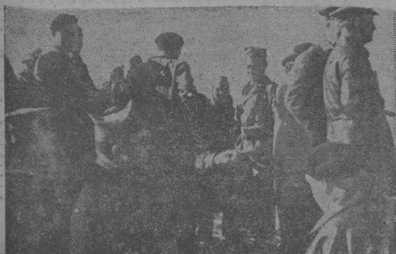
El general Rojo y su E. M., observando las operaciones en las calles de Teruel