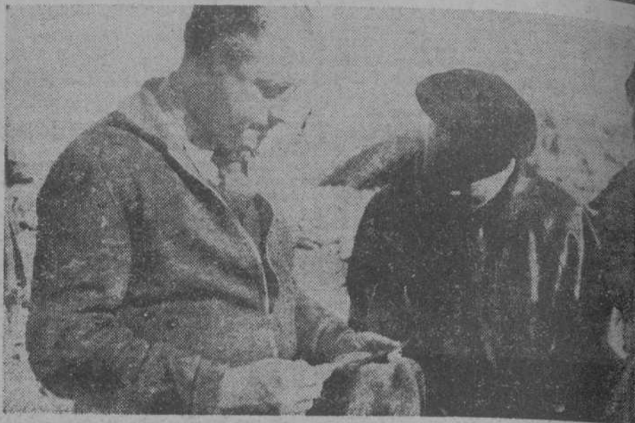
El ministro de Defensa, con el diputado Ragasol, examinando billetes emitidos por los facciosos en Teruel