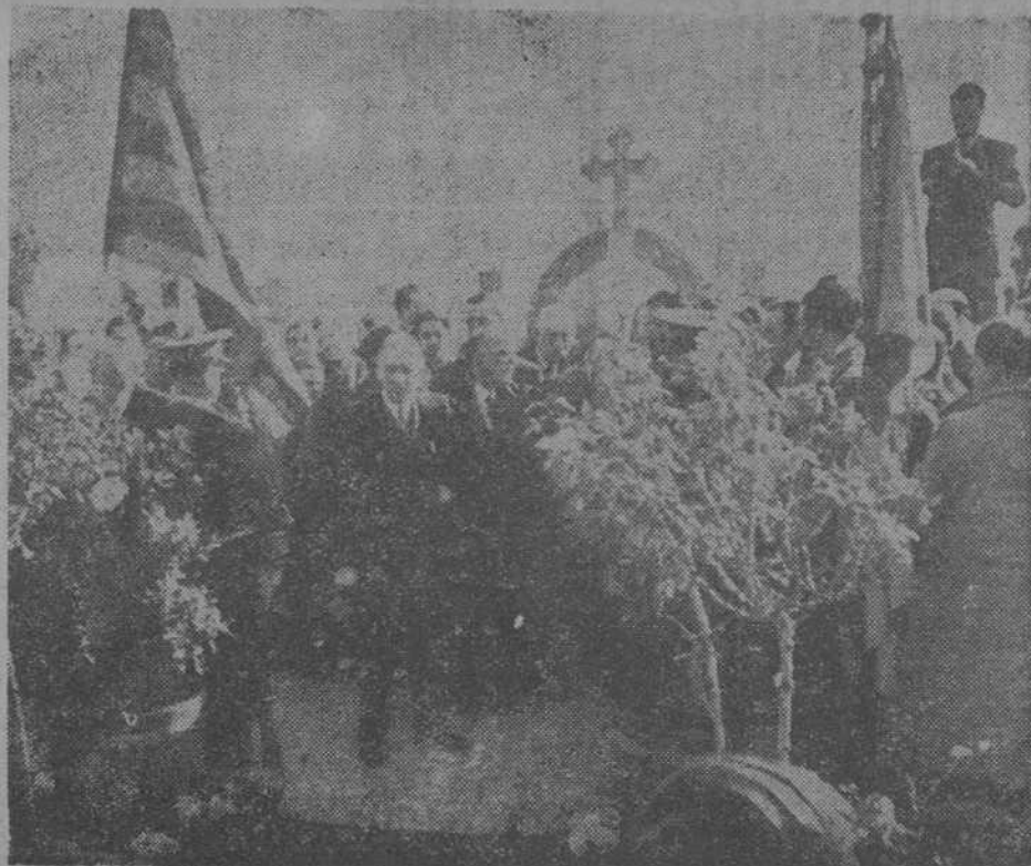
El Presidente Companys, con varios consejeros de la Generalidad y el ministro de la República Giner de los Ríos