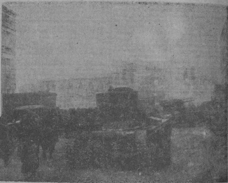
Los tanques y camiones del Ejército de la República, después de tomada la plaza de toros de Teruel, en la que ondea la bandera de la República