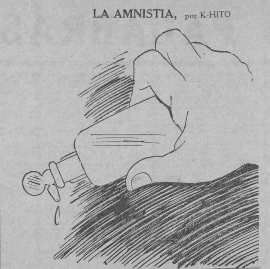
De botella... y con cuentagotas.