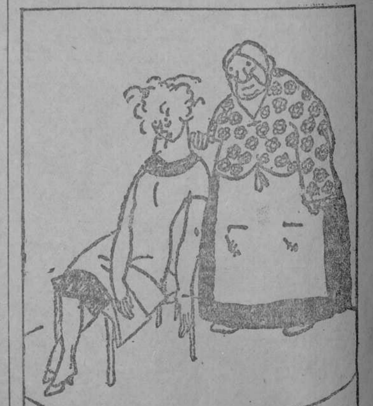
—Es muy instruido, mamá. —¡Naturalmente! Como que ha estado dos años con un juez de instrucción. (San Gène, París.)