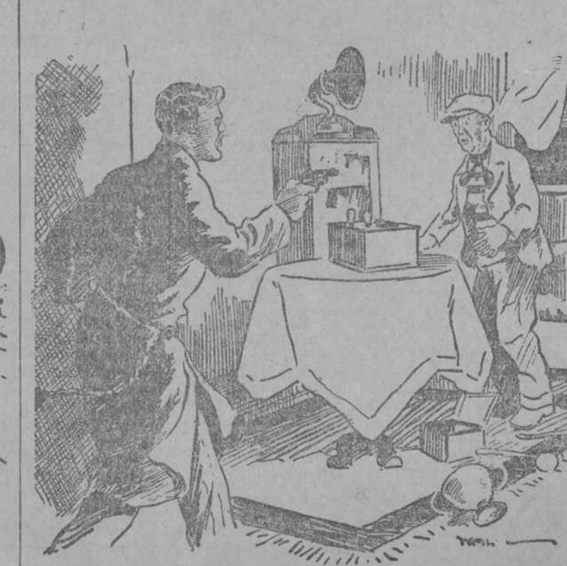
EL DUERO DE LA CASA.—¿Qué hace usted ahí? EL LADRON (sorpresa)—Viendo si tenía usted licencia para la radio. (Passing Show, Londres)