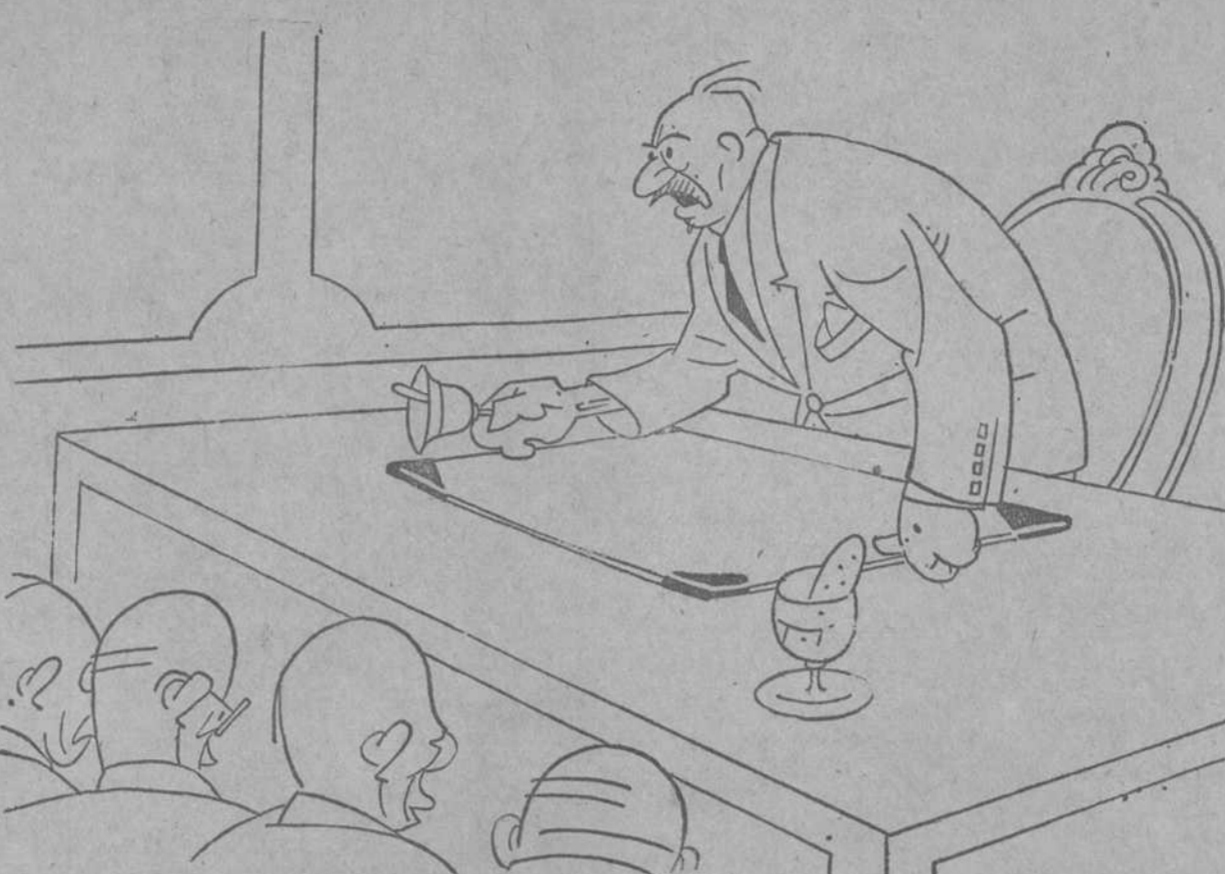
EL PRESIDENTE.—¡Al grano! ¡Al grano!