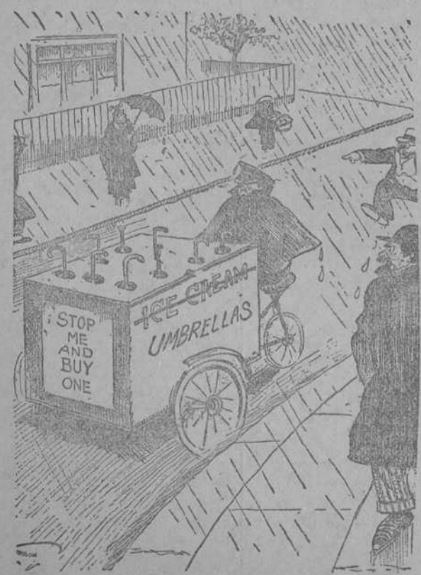
Como hombre práctico, en vista de los encantos del verano, el vendedor de helados cambia su negocio. (London Opinton, Londres.)

N. de B. R.—Dinosa la noticia precedente a título de información, y sólo por haber sido presentado el caso ante un Congreso científico.