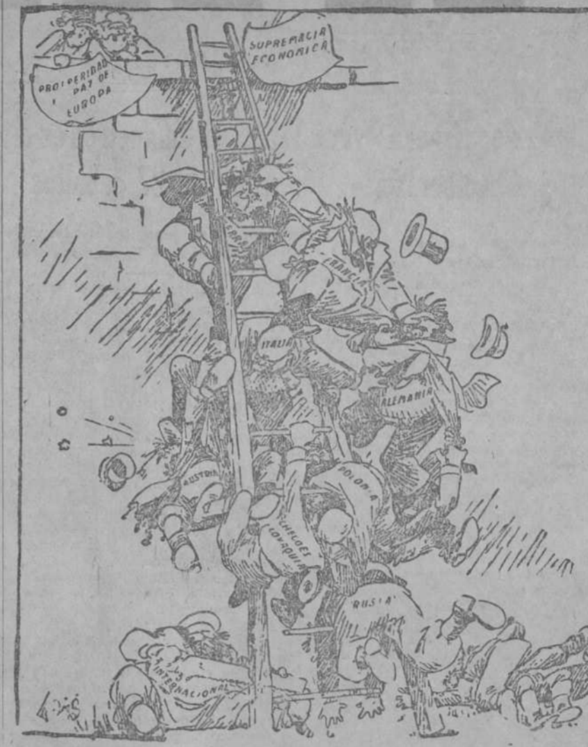
«Si se ayudasen en vez de combatirse, hace tiempo que hubiesen llegado arriba.» (Chicago Post.)