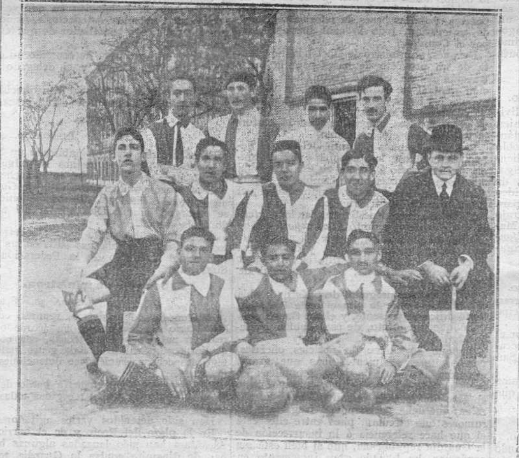
TEAND' DEL INSTITUTO CATOLICO DE ARTES E INDUSTRIAS