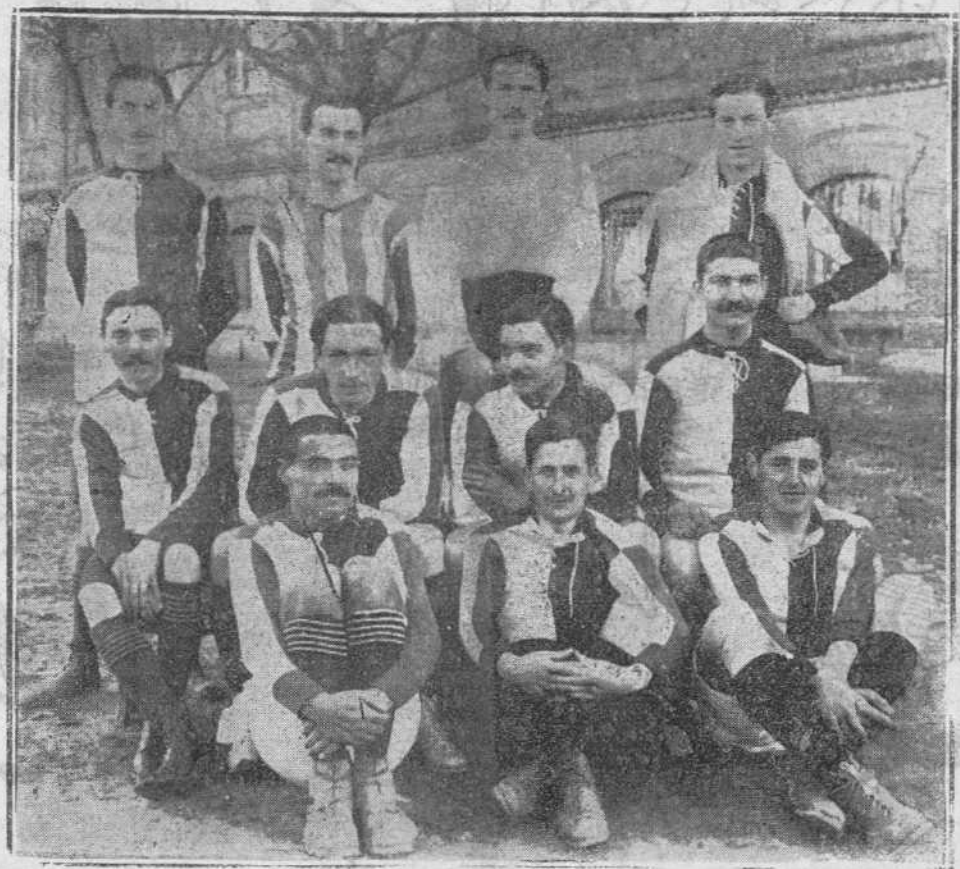
TEAND' DE LOS LUISES, DE MADRID