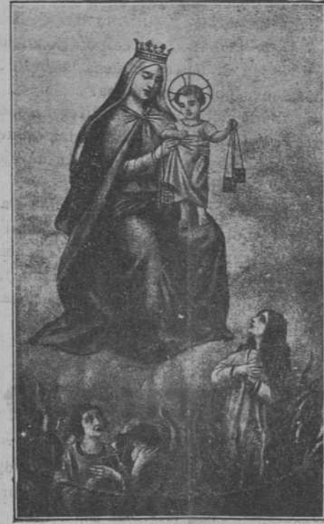
NUESTRA SEÑORA DEL CARMEN, PATRONA DE LA MARINA

Pero, a pesar de la opinión del suboficial austriaco, Marchar se obstina en que nació en febrero. Y ahora se muestra orgulloso de haber sido nombrado inspector general del Ejército checoslovaco pocos días después de cumplir los «catorce» años.