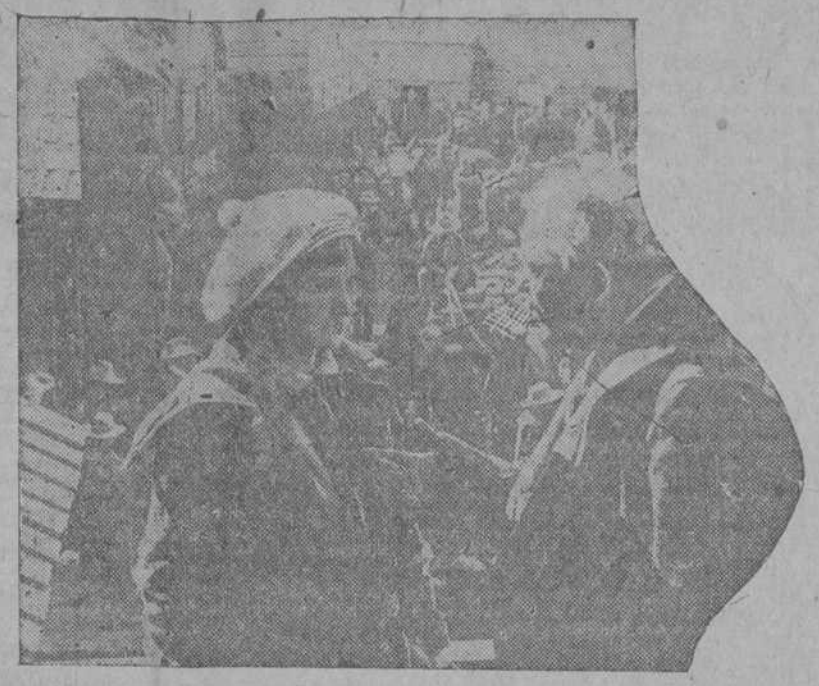
Una de las sugestivas escenas de la gran película "Entre la carne y el oro", que será estrenada el sábado, día 3 en el "Capitolio".

La admirable película "Entre la carne y el oro", que será estrenada el sábado en el "Capitolio".