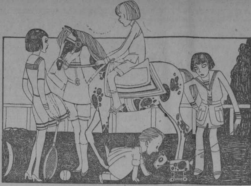
(Dibujo de Carlos)

Vajillas de cristal compuestas de: 12 copas para agua 12 " " vino 12 " " Jerez 12 " " Champagne 12 " " licor 1 jarro para agua 61 piezas Precio Especial: $18.00 HIERRO Y COMPANIA S. en C. Obispo 68 O'Reilly 51.