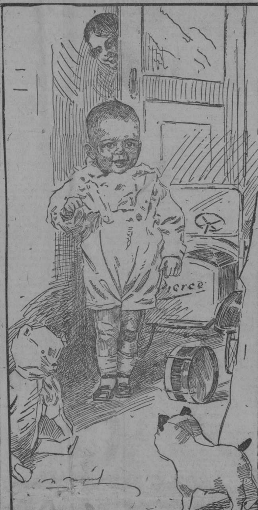
—MAMA, MAMA! DALE MIS JUGUETES AL NIÑO SIN MANOS.