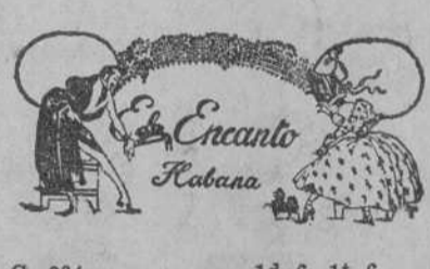
C. 284 1d.-6. 11.-6.

—Mira, Nena—decíale cubriéndola de besos—, te voy a llevar a El Encanto. Ya verás cuántas cosas hay para tí. Hay abriguitos de niñas para todas las edades. Son muy lindos. Yo los ví ayer. Colores, estilos, calidades... ¡Una gran variedad! Entre ellos escoges para tí el que más te guste. Y después verás otras cosas. Ropa interior, vestidos... ¡Lo que tú quieras!