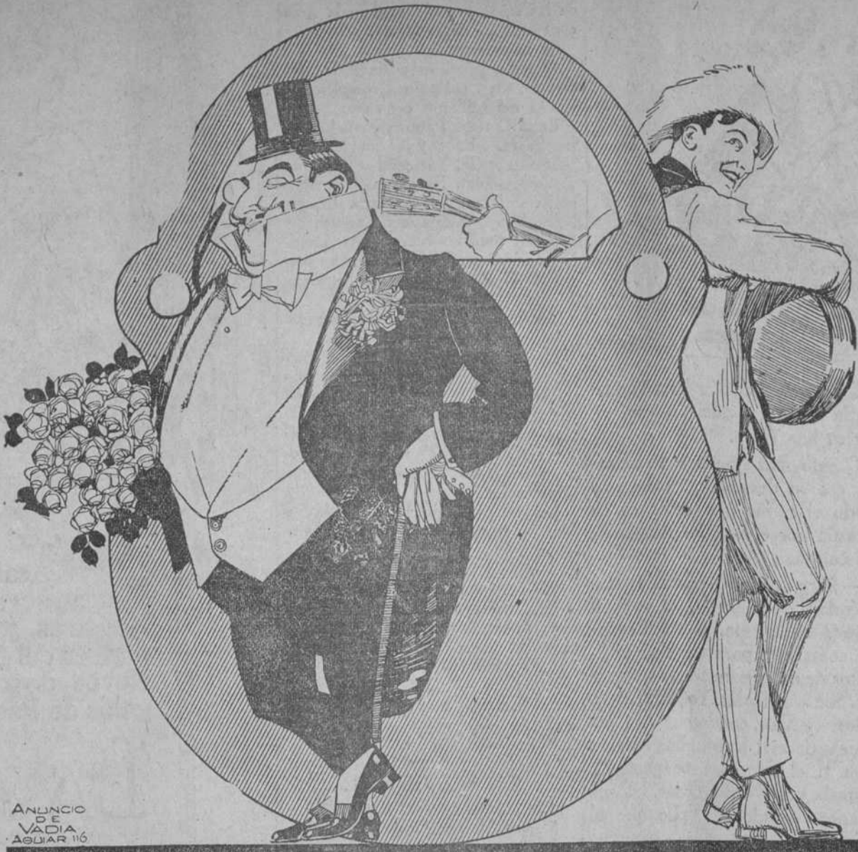
ANUNCIO DE VACIA AGUIAR 116