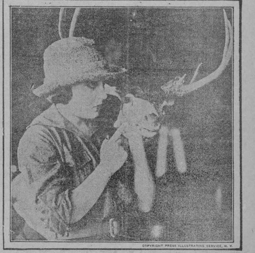
GLORIA SWANSON, CONOCIDA ARTISTA CINEMATOGRAFICA, E INTREPIDA CAZADORA, CON UNO DE SUS TROFEOS.