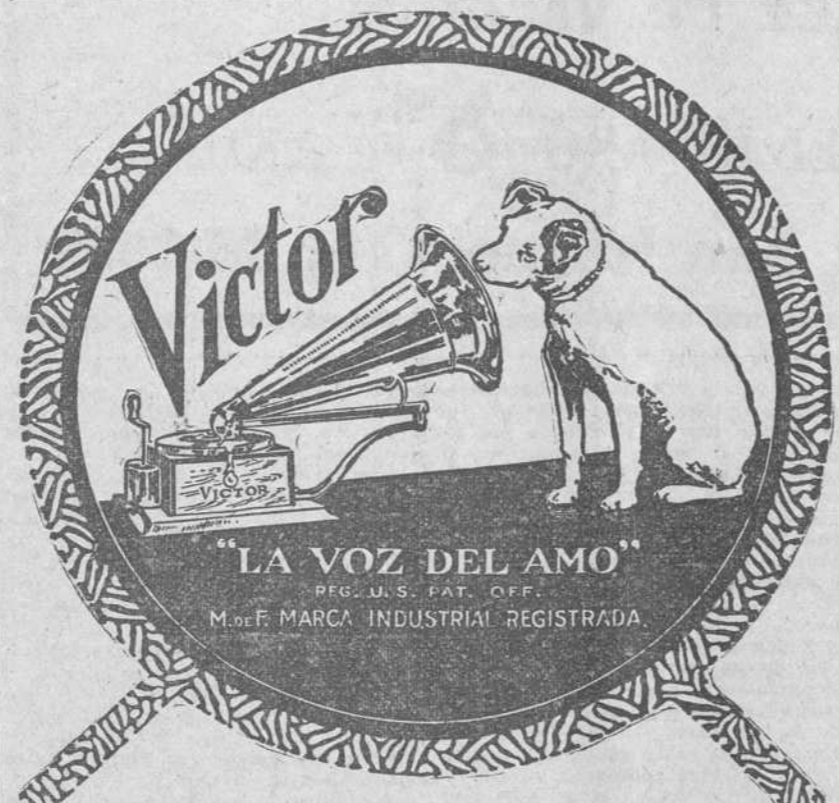
Este grabado, intensamente natural, representa todo lo mejor que hay en materia de música