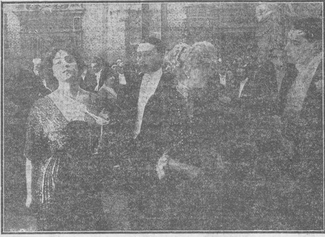
Inmediatamente después de ser escarnecida por la traición del esposo, se le presentaba la tentación de la venganza, en la persona del marqués de Renzís... ¿Triunfaría su virtud?.....

SANTOS Y ARTIGAS avisan al público que ya están los argumentos de película cubana “La Hija del Policía” o “En poder de los Náñigos,” como también “Maciste, Soldado Alpino”.