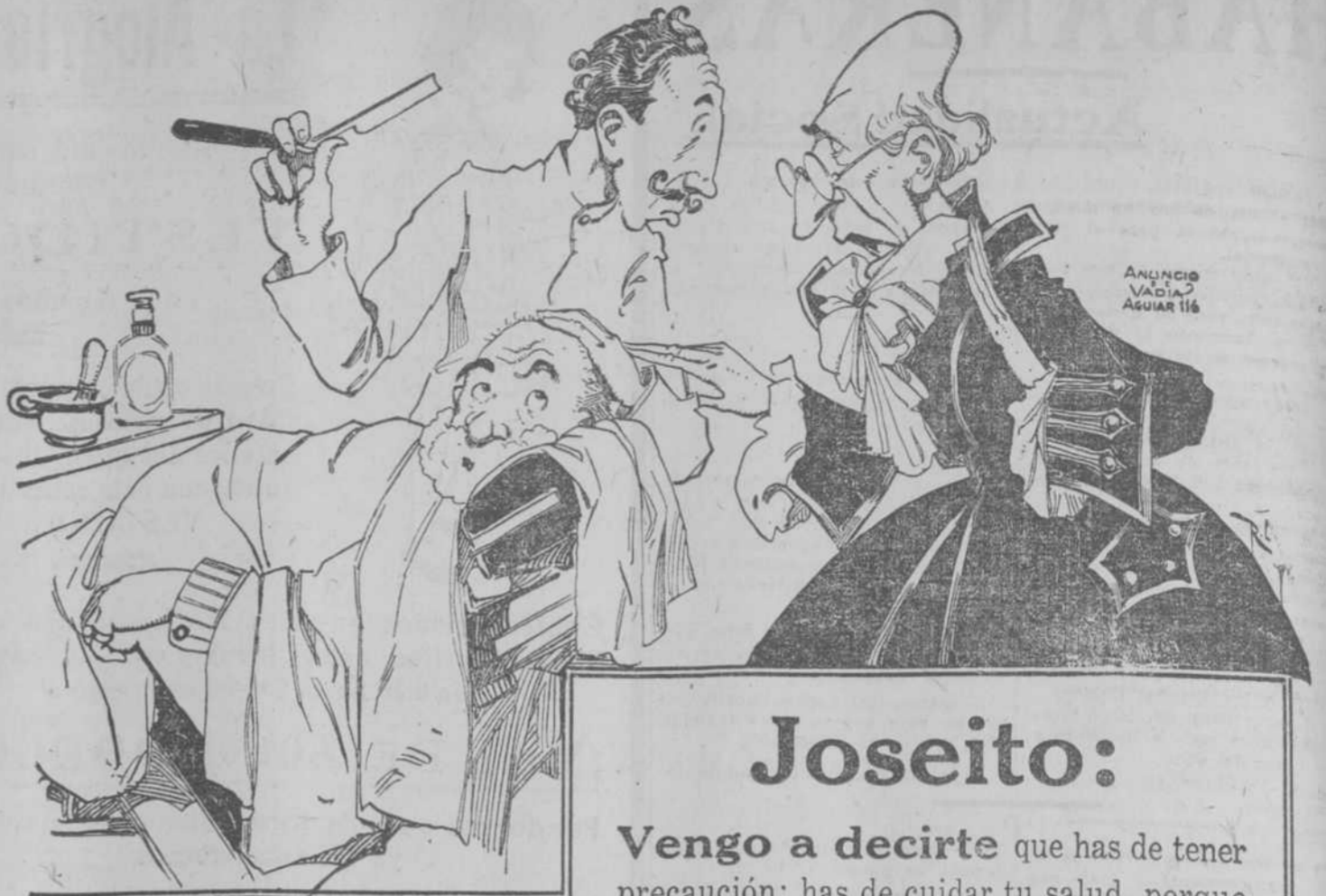
ANUNCIOS VADIAZ AGUIAR 116