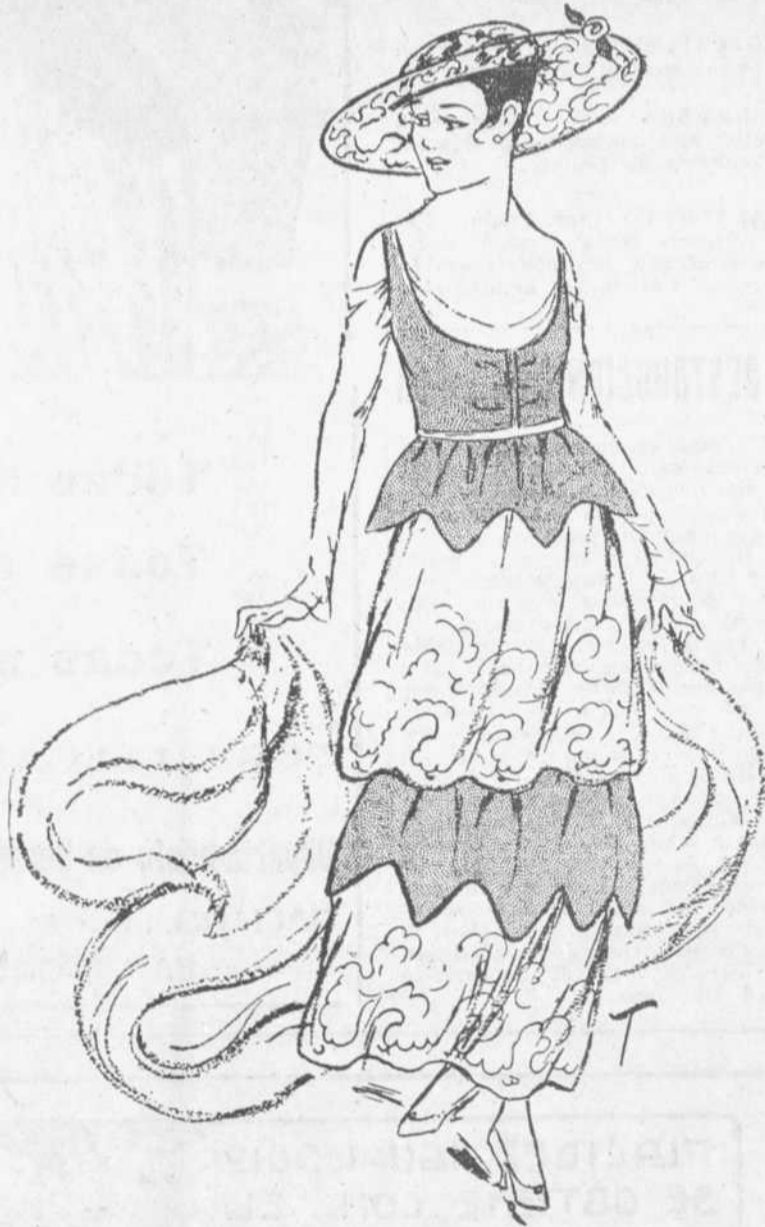
Traje de tafetán azul, con flecos de plata y encaje. El sombrero, gran, luce adornos de plata y, en el reborde, una rosa encarnada.