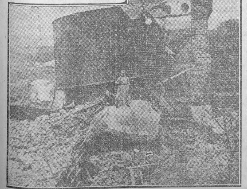
Depósito de agua demolido.