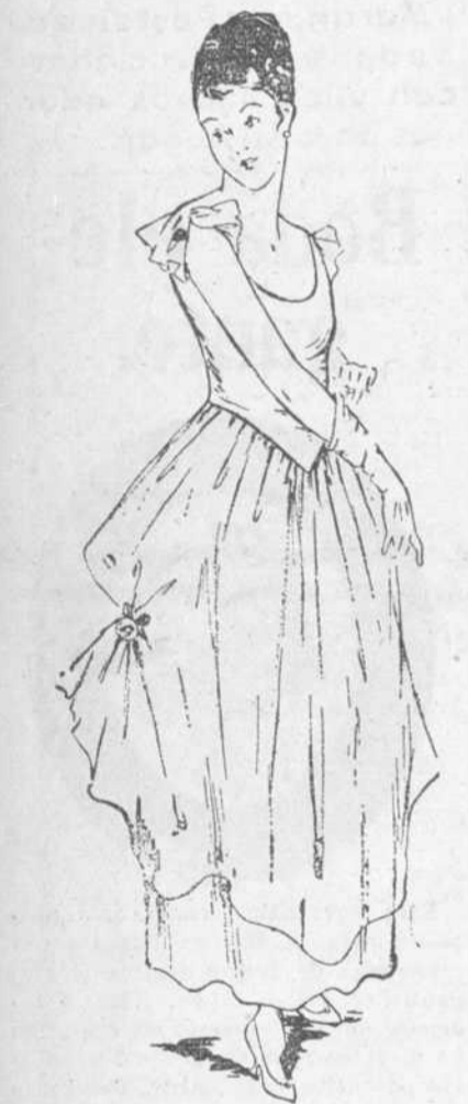
Un paso más hacia el malacó: Traje de tafetán azul; el cuerpo del vestido, de tul blanco; y, recogiendo el vuelo de la sobrefalda, una rosa encarnada.

rantes, cosas útiles, es lo que se necesita y hay que apurarlo a toda costa. Será ciertamente el gran bien, el único bien de estas horas tristes y de crisis general, imponiendo silencio absoluto a nuestras pequenezas y acudiendo al tesoro escondido en el fondo de nuestra conciencia.