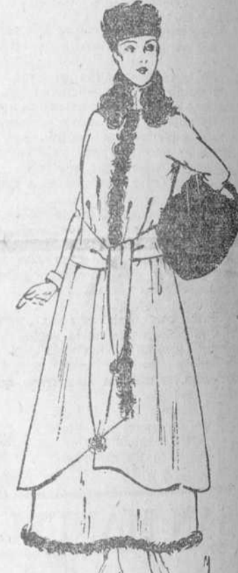
Traje de paño verde; una variada, te del chaquetón. En el cuello, el cierre y "reborde" de la falda, adornos de "astrakán".

A nuestro juicio, el azúcar debe usarse en gran cantidad, porque endulza la vida y nutre mil veces más que un trozo de solomillo. No parece posible imaginar un paraiso sin mucha azúcar, y, sin embargo, hay seres que necesitan partir un terrón para echar medio en la taza de café; y como no sería correcto partirlo con la mano, consideramos indispensables en toda mesa bien servida las tenacillas cortantes. Tienen la misma forma de unas tijeras con las puntas redondas; se coge el terrón de azúcar y, sin sacarlo del azucarero, se oprime ligeramente y se parte en el acto.