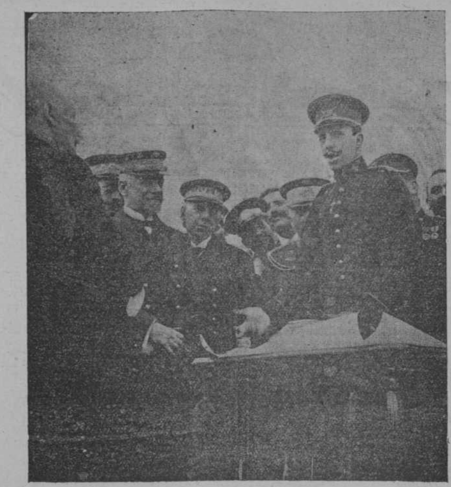
El rey don Alfonso XIII pronunciando un patriótico discurso, antes de firmar el pergamino conmemorativo de la inauguración del Canal del Ebro en Treynis ( Tortosa ).

de contratos muy satisfactorios, que suceden á los antiguos, acrecentando las rentas y el valor de los capitales.