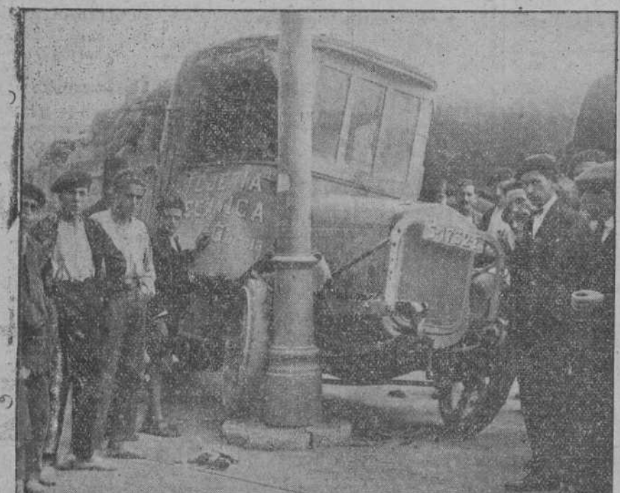
Estado en que quedó el camión que chocó ayer mañana con una columna en la Avenida de Alfonso XIII..