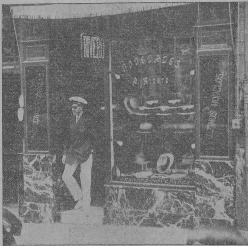
Su Alteza el príncipe de Asturias saliendo ayer mañana de efectuar compras en la sombrerería de Rivero.

yes pasearon por la bahía a bordo de la «Packun-Tu-Zin», bordeando los buques de las dos divisiones.