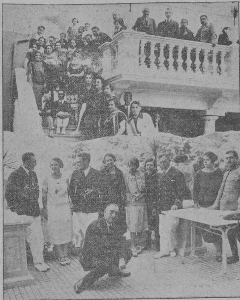
DE LA EXCURSION DE LOS MARINOS A ONTANEDA.— Grupo de bellas señoritas de Ontaneda y de la colonia veraniega con algunos de los excursionistas. (Foto SAMOT).

Dentro de pocos días no habrá secreto y nos ocuparemos del asunto con mucho gusto.