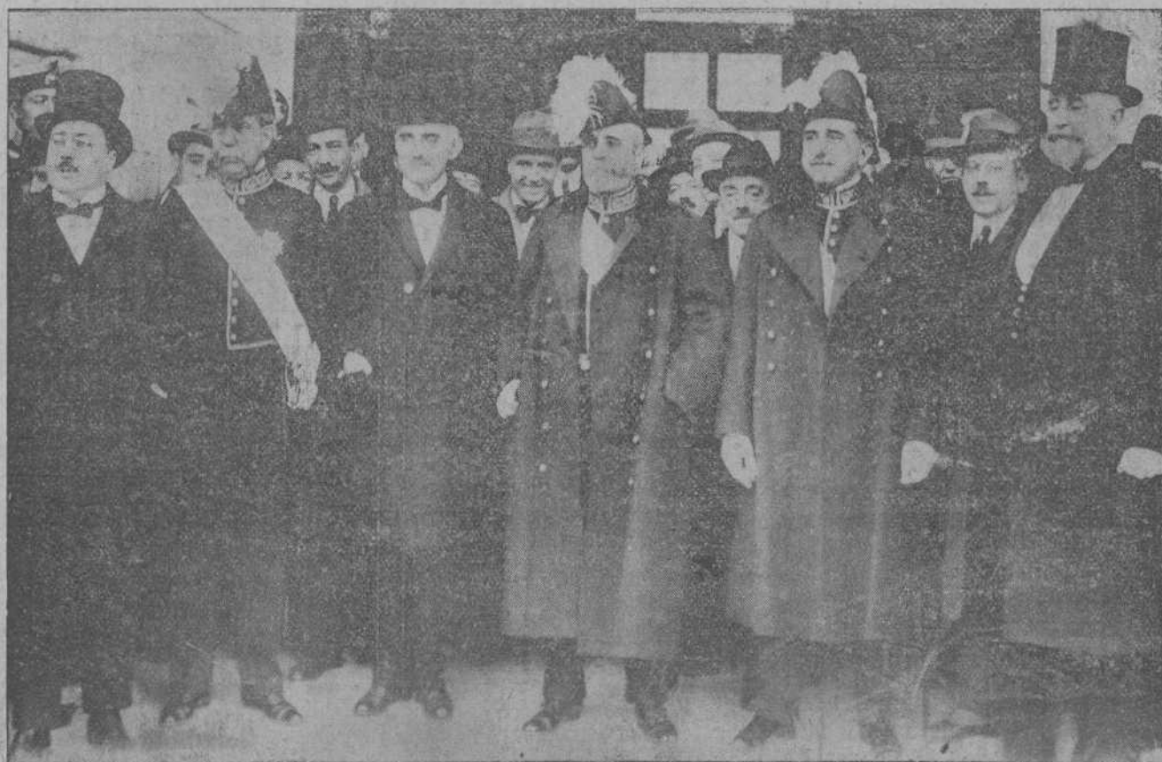
EL NUEVO GOBIERNO QUE AYER CAYO EN EL CONGRESO, AL SALIR EL LUNES DE JURAR.

El señor LA CIERVA: La crisis fué parlamentaria y no hay razón para esas acusaciones.