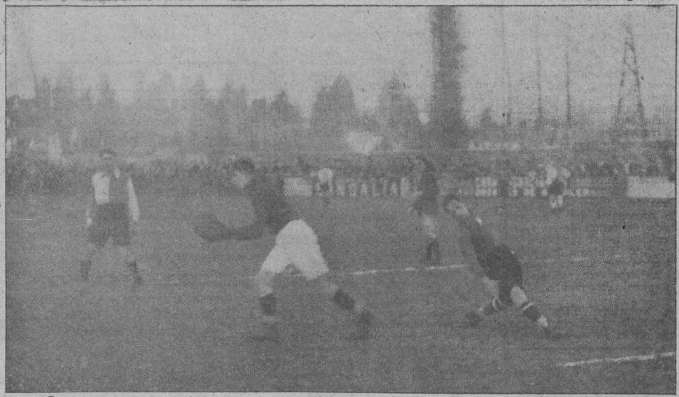
DEL PARTIDO UNION MONTANESA-GIMNASTICA EN TORRELAVEGA.—UNA DE LAS SALIDAS DEL PORTERO DE LA GIMNASTICA, QUITANDO EL BALON A CIRIACO, QUE SE DISPONIA A CHUTAR

Se castiga con un corner a la Unión y los locales se encargan de convertirlo en goal. Y con este resultado de tres a dos, Machín dió por terminado el partido.