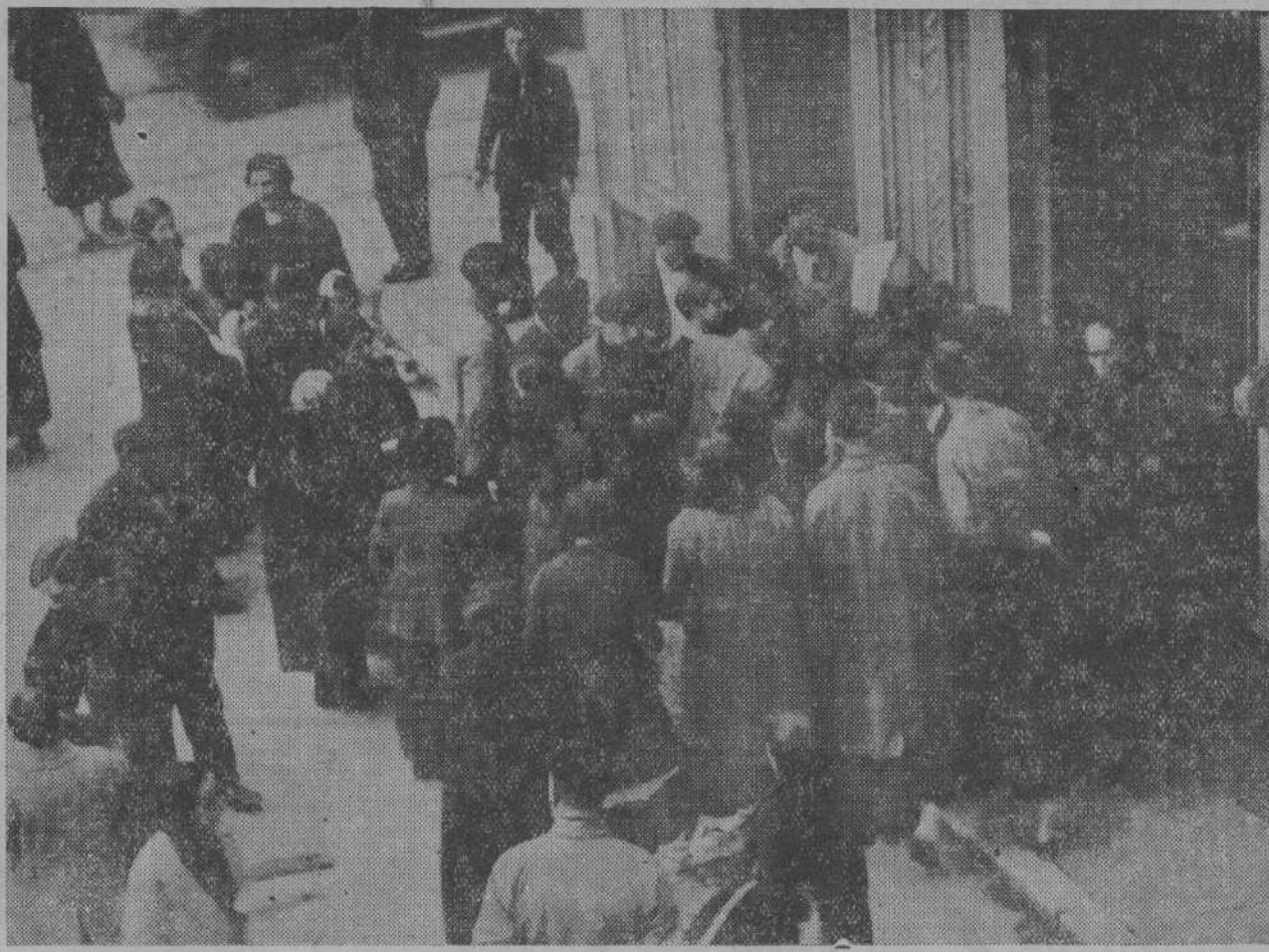
La influencia del "gordo" de Navidad se hizo notar ayer en las calles de Santander y a la salida de los mercados. Los vendedores de participaciones se vieron rodeados de público, que les compró muchas para el próximo sorteo. Lo último que se puede es la ilusión, y como un niño, el pueblo se siente invadido por el optimismo, pensando que los Reyes Magos pueden traerle otro premio mayor...