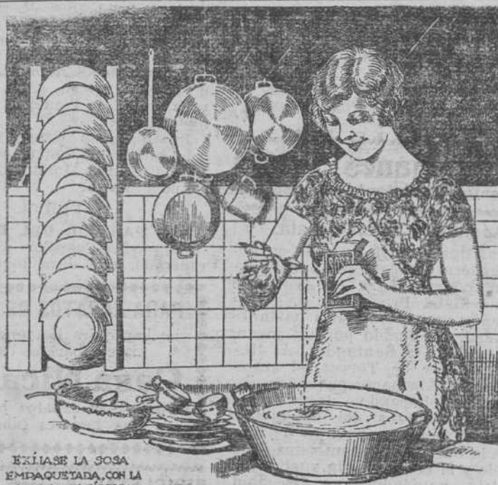
EXIASE LA SOSA EMPAQUETADA, CON LA MARCA DE FABRICA

Partos, ginecología (enfermedades y cirugía de la mujer), medicina interna. De once a doce y media, Sanatorio Madrazo. De doce y media a dos, Cañido, 1, segundo (excepto los días festivos).