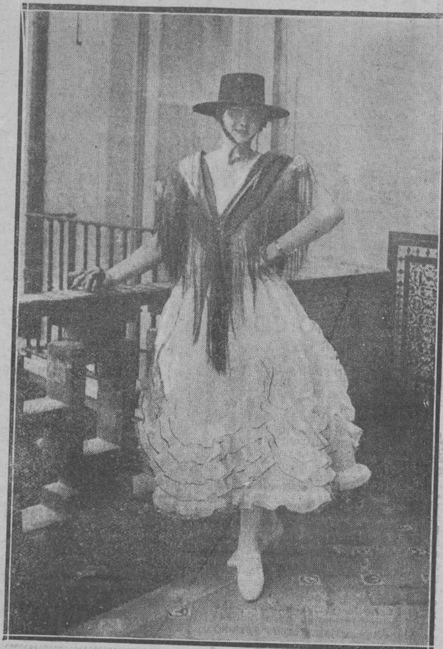
La bella Princesa Ileana, de Rumania, durante su estancia en Sevilla, gustó de hacerse este retrato vestida a lo flamenco. Es posible que, andando el tiempo, cuando en unión de su augusta madre regrese a su país, la princesita vea este retrato publicado en aquellos periódicos con una línea al pie diciendo: «La Princesa Ileana con el traje que visten las mujeres españolas».

Mañana o pasado daremos a conocer en su integridad el programa de tan extraordinaria fiesta.