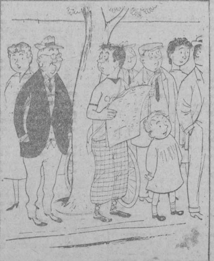
—Oye, chaval, ¿este año no corre Trueba?