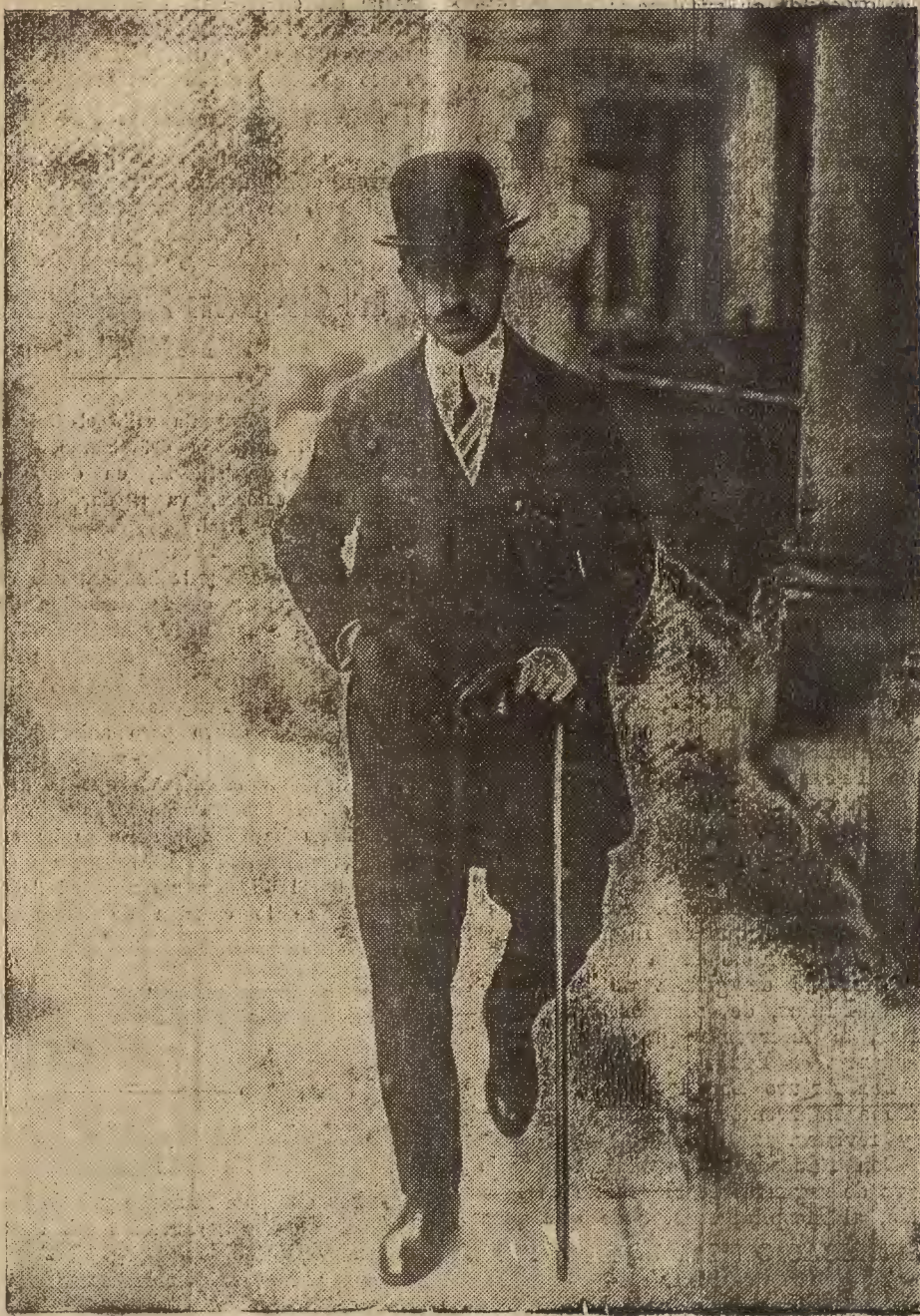
FIGURA DE ACTUALIDAD

El político búlgaro Kalkoff, a quien el rey Boris ha encargado la formación de nuevo Gobierno.