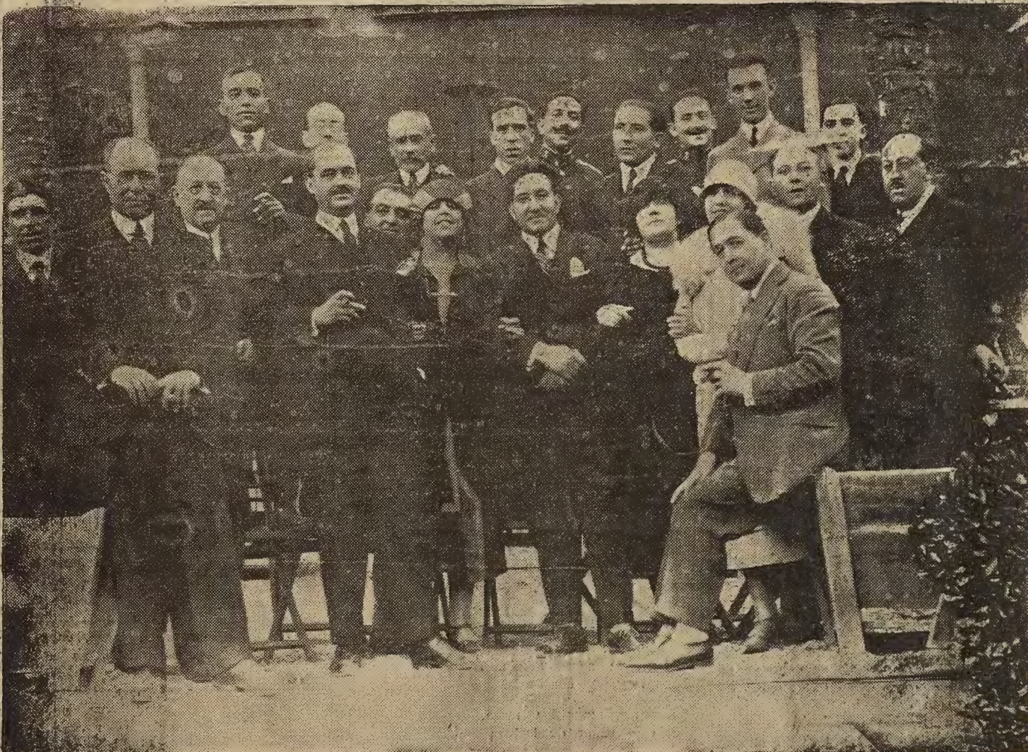
EL TENOR FLETA Y LAS PERSONAS QUE COMIERON CON EL AYER TARDE EN UN RESTAURANT DE TORREO