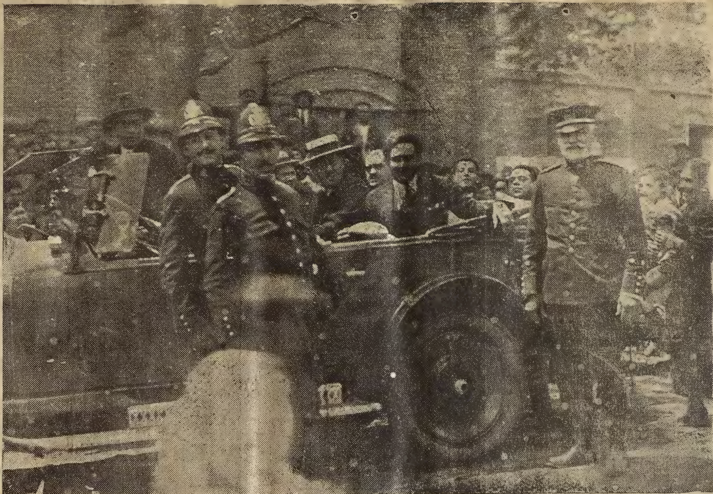
MIGUEL FLETA EN EL AUTOMOVIL QUE OCUPÓ AL SALIR DEL TEMPLO DEL PILAR, DESPUES DE HABER CANTADO UNA PLEGARIA

4.º Ampliación de la enseñanza de las letras clásicas para expandir los sentimientos de fraternidad y de benevolencia que en ellas se encuentran.