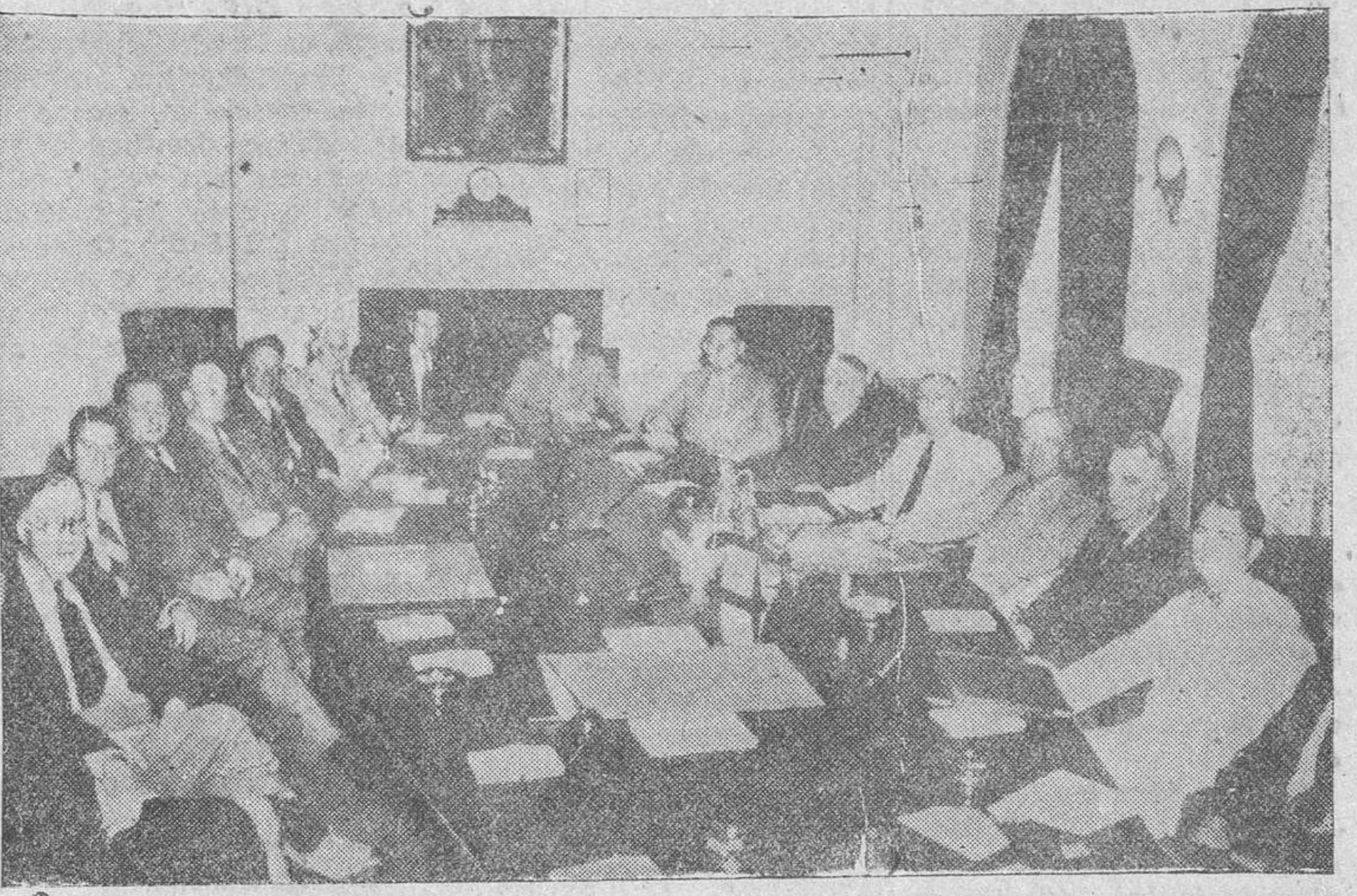
El presidente Truman y los miembros del Gobierno estadounidense, en una reunión extraordinaria celebrada en la Casa Blanca, para tratar de los problemas de la postguerra