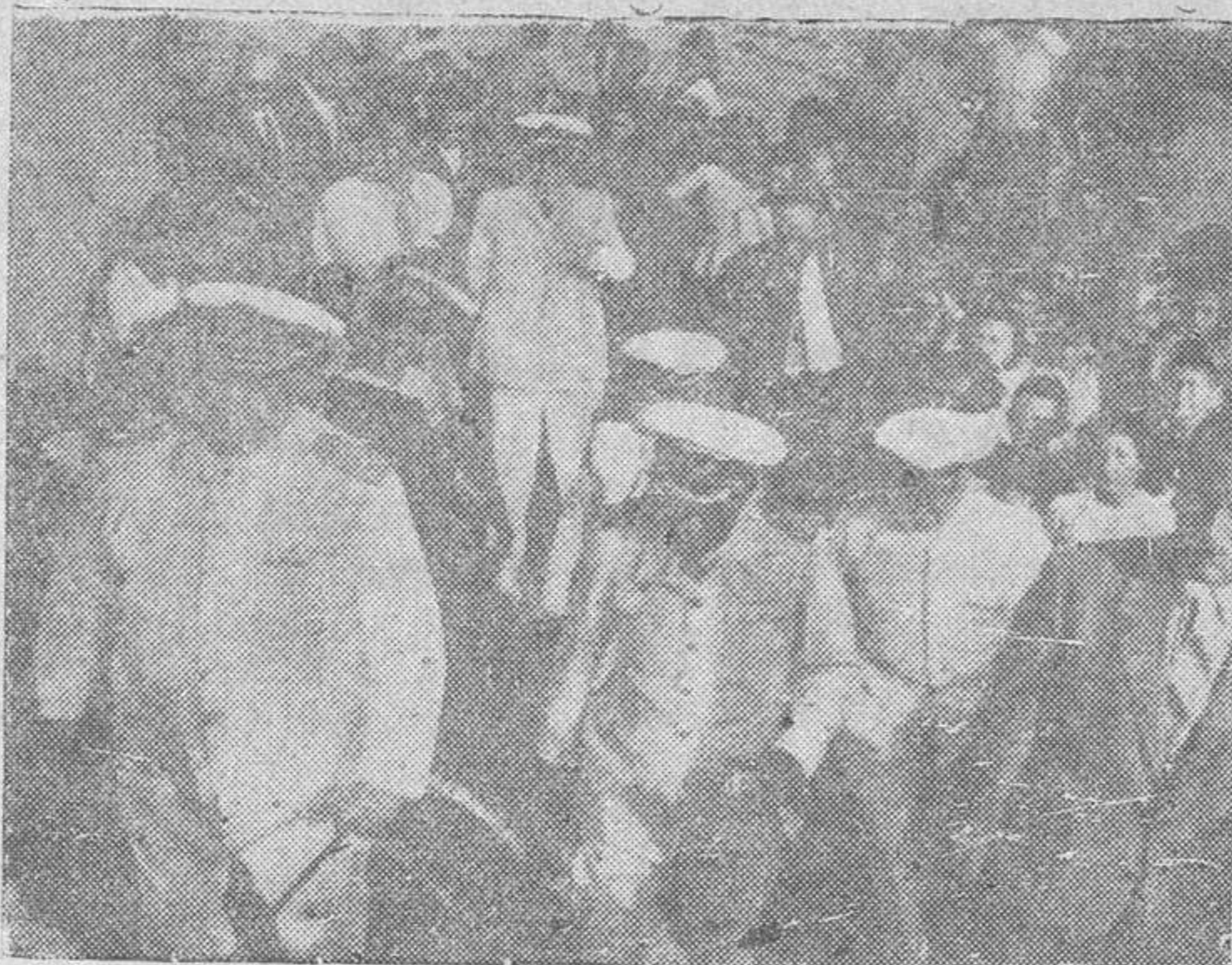
Tarragona.—El almirante Bastarache y otras autoridades visitan el Pósito de Pescadores y la Comandancia de Marina en San Carlos de la Rápita