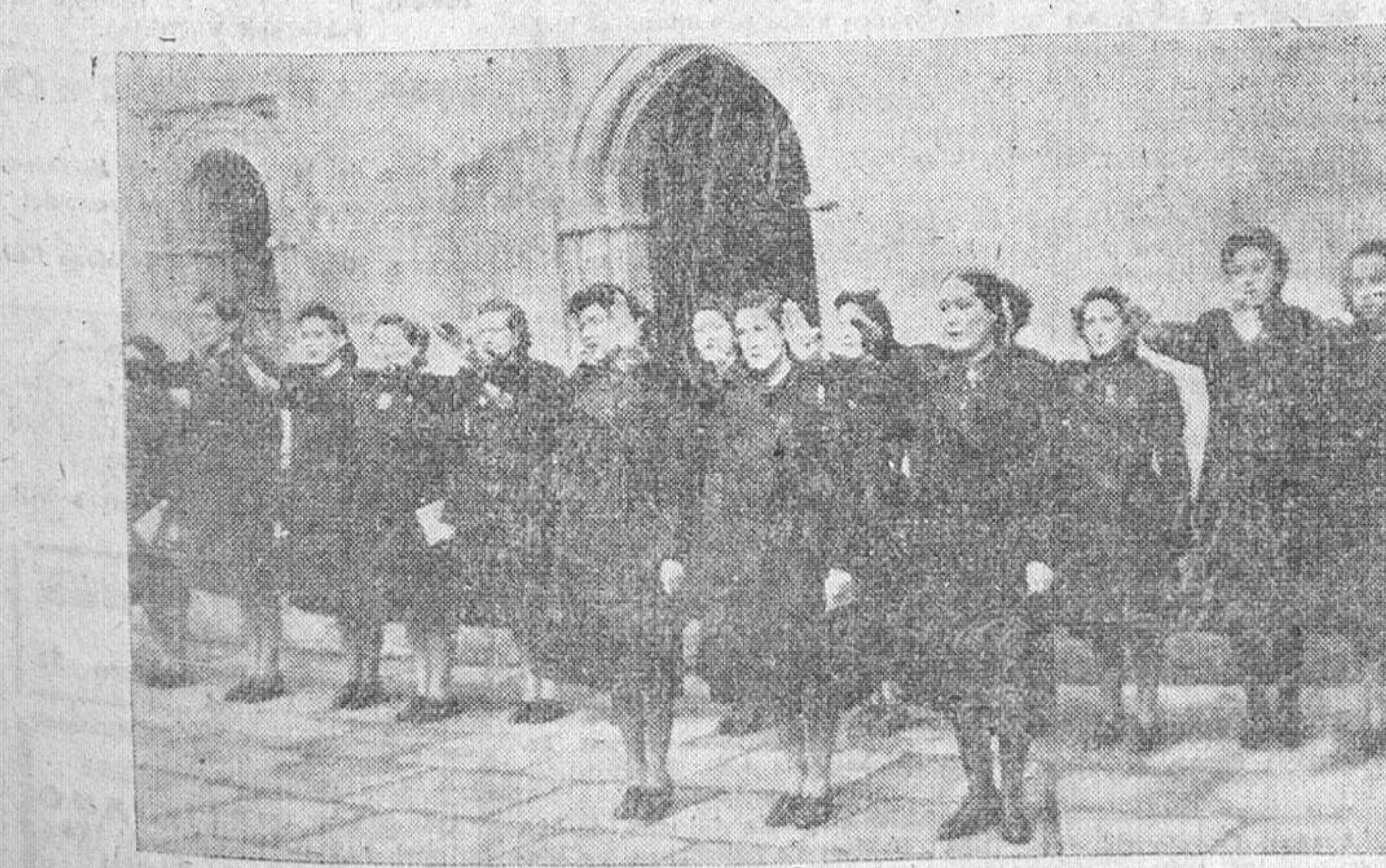
La delegada nacional, Pilar Primo de Rivera, con las camaradas que toman parte en el Consejo, saludando en el momento de izar banderas, en el patio del Monasterio de Guadalupe.