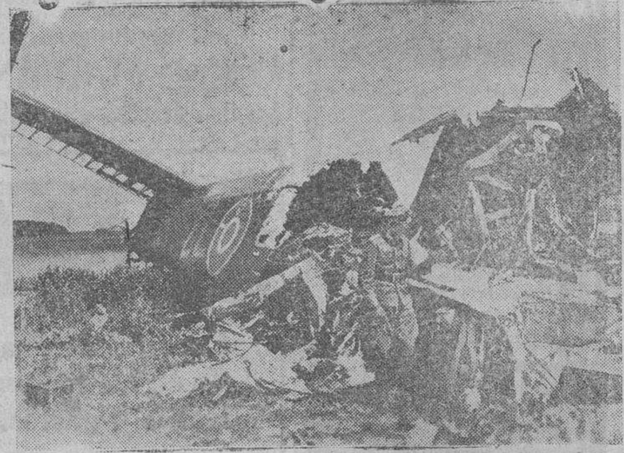
Al intentar realizar una incursión sobre territorio alemán, fué derribado este avión inglés por las baterías antiaéreas alemanas que aseguran cada ciudad.