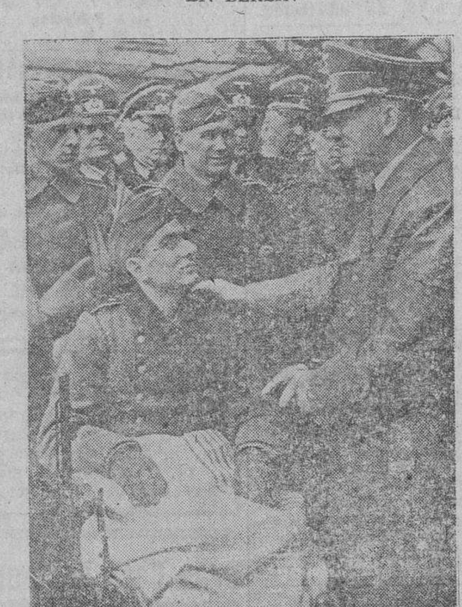
El Führer saluda ante el monumento de honor Unter den Linden, en Berlín, a los heridos que presentaron como huéspedes de honor la fiesta.