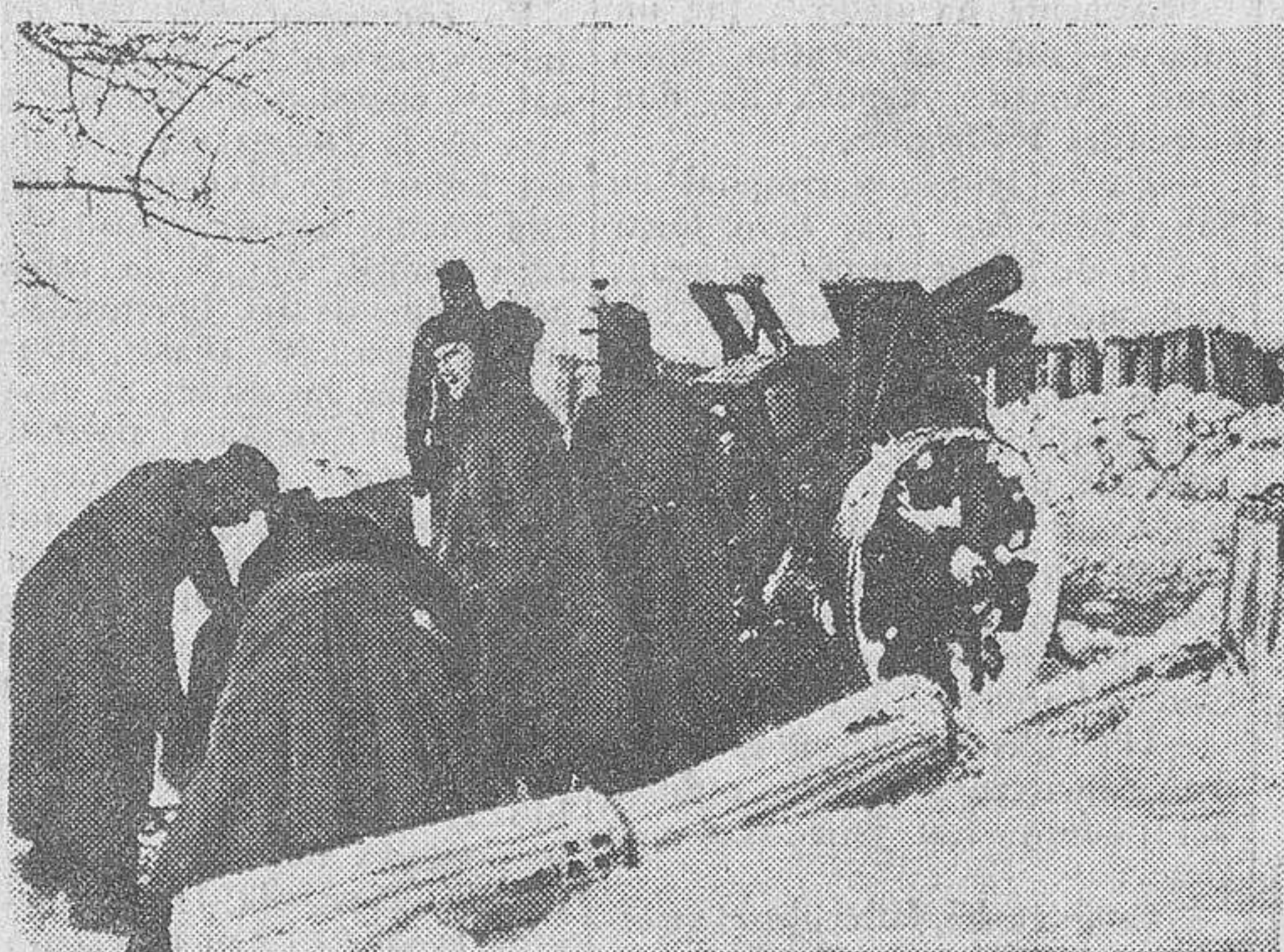
Cañón pesado alemán de infantería en fuego concentrado sobre fortificaciones soviéticas.

Cuartel General del Führer.—Comunicado del Alto Mando de las fuerzas armadas alemanas: "A pesar de los violentos ataques de carácter local lanzados por el adversario, se comprueba una disminución notable de la actividad ofensiva del enemigo en el frente oriental. Ha sido ocupadas un número bastante importante de localidades en el curso de las operaciones ofensivas alemanas. En la costa caucásica los aviones de bombardeo alemanes incendiaron un petrolio soviético de gran tonelaje. En aguas de Kerch, un buque mercante, también de importante tonelaje, resultó averiado. En el Norte de África, los bombarderos alemanes alcanzaron con sus bombas a los mercantes enemigos cerca de Tobruk. En combates aéreos, seis aparatos británicos han sido derribados.