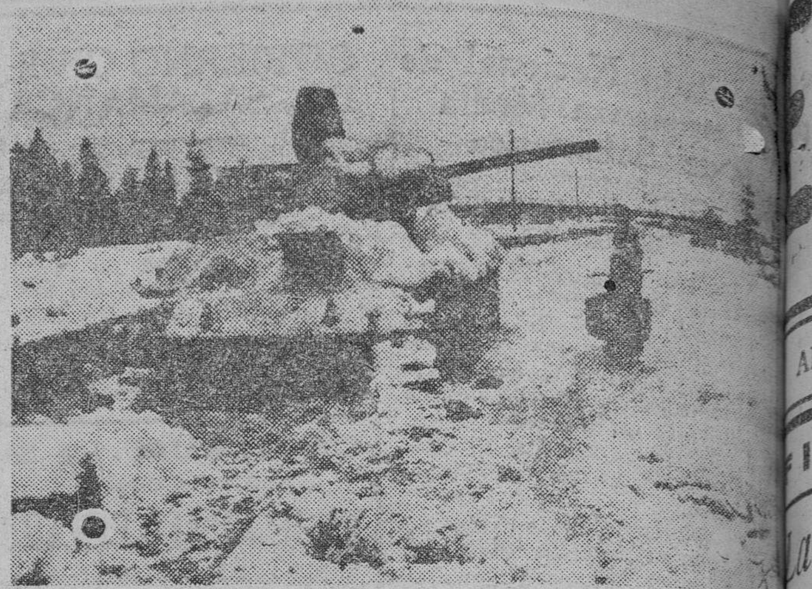
Estampas que se repiten. He aquí un tanque soviético inutilizado por un antitanque alemán y que ha sido cubierto por la nieve

Varios señores Obispos tienen concedidas indulgencias.