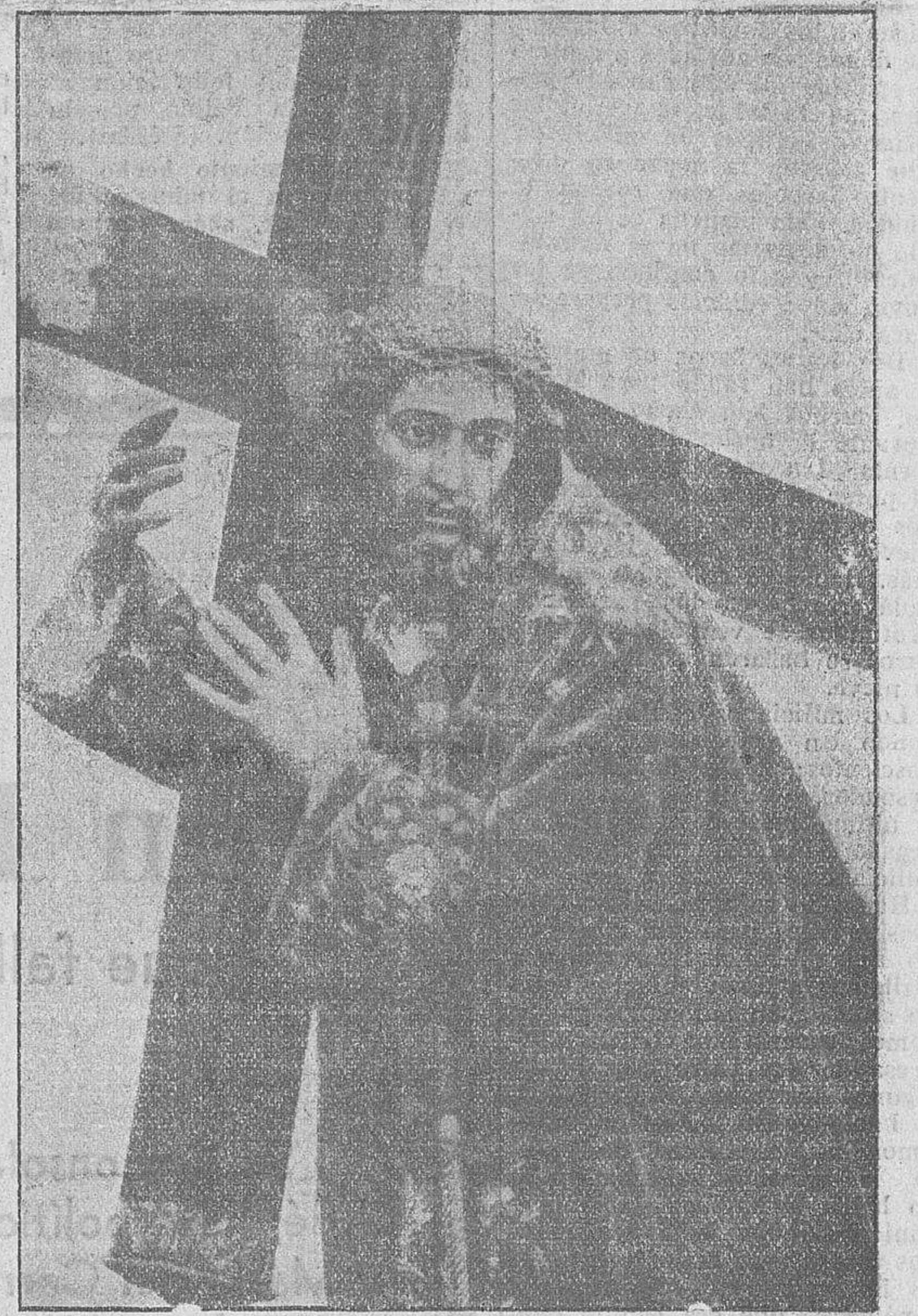
Esta tarde se celebrará la solemne procesión de Jesús Nazareno, que hemos venido anunciando durante los últimos días. Se desarrollará en la siguiente forma:

Salida de San Julián a las seis y media en punto, acompañando la banda del Regimiento.