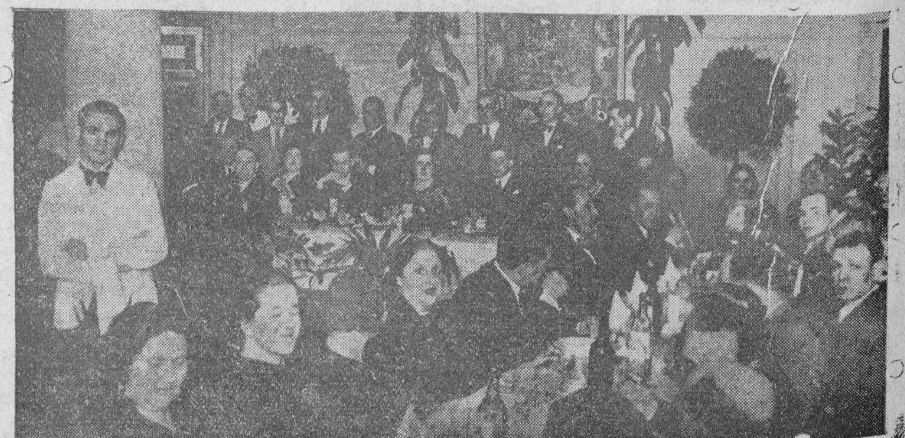
En honor de los miembros directivos y destacados socios de las Casas regionales de Madrid, ha tenido lugar un banquete en el domicilio social de la de Guadalajara. Una vista parcial del salón