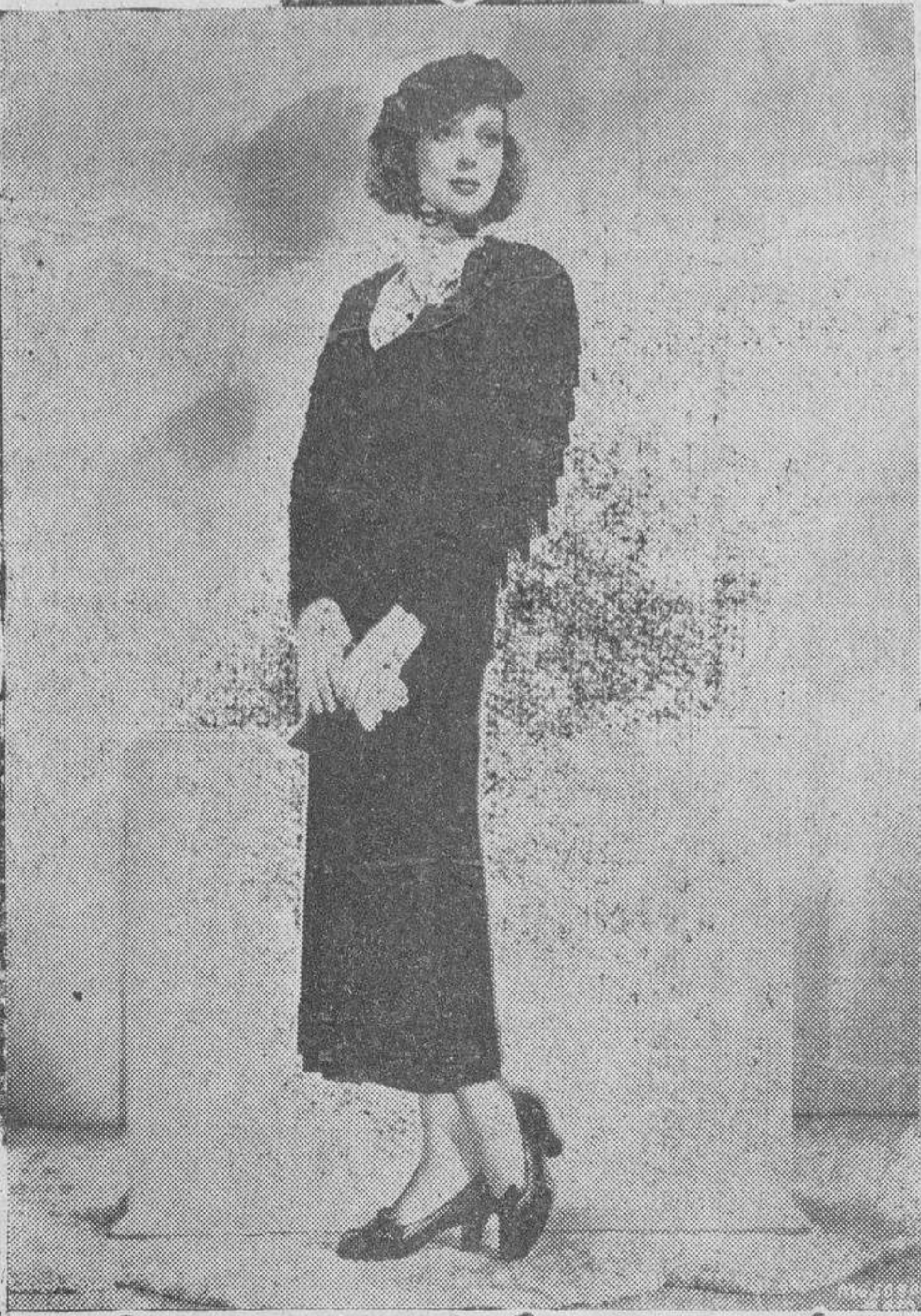
Loretta Young con el elegante vestido azul marino que luce en una nueva producción de la Metro Goldwyn Mayer