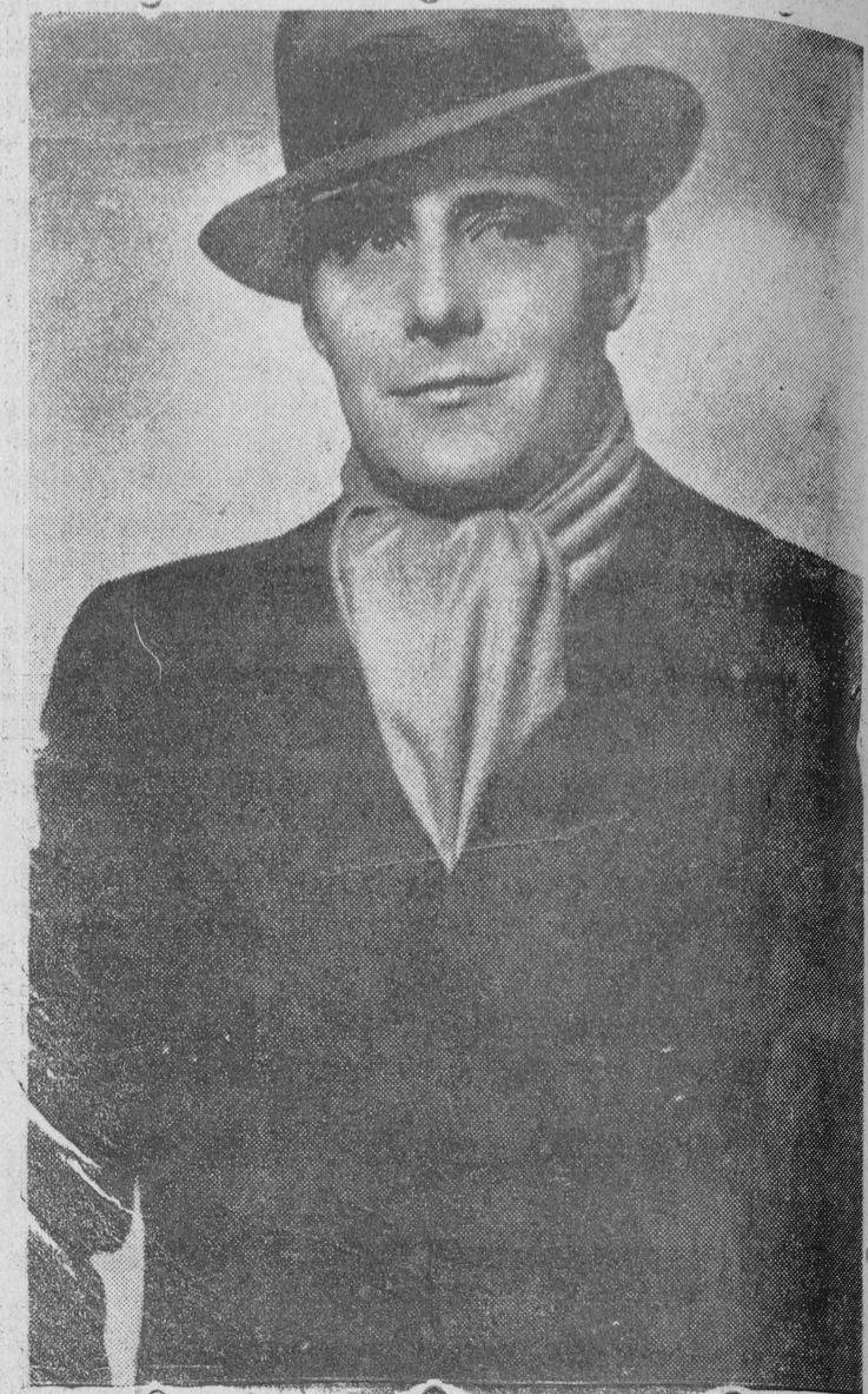
El gran actor Henry Garat, uno de los galanes de más positivo mérito