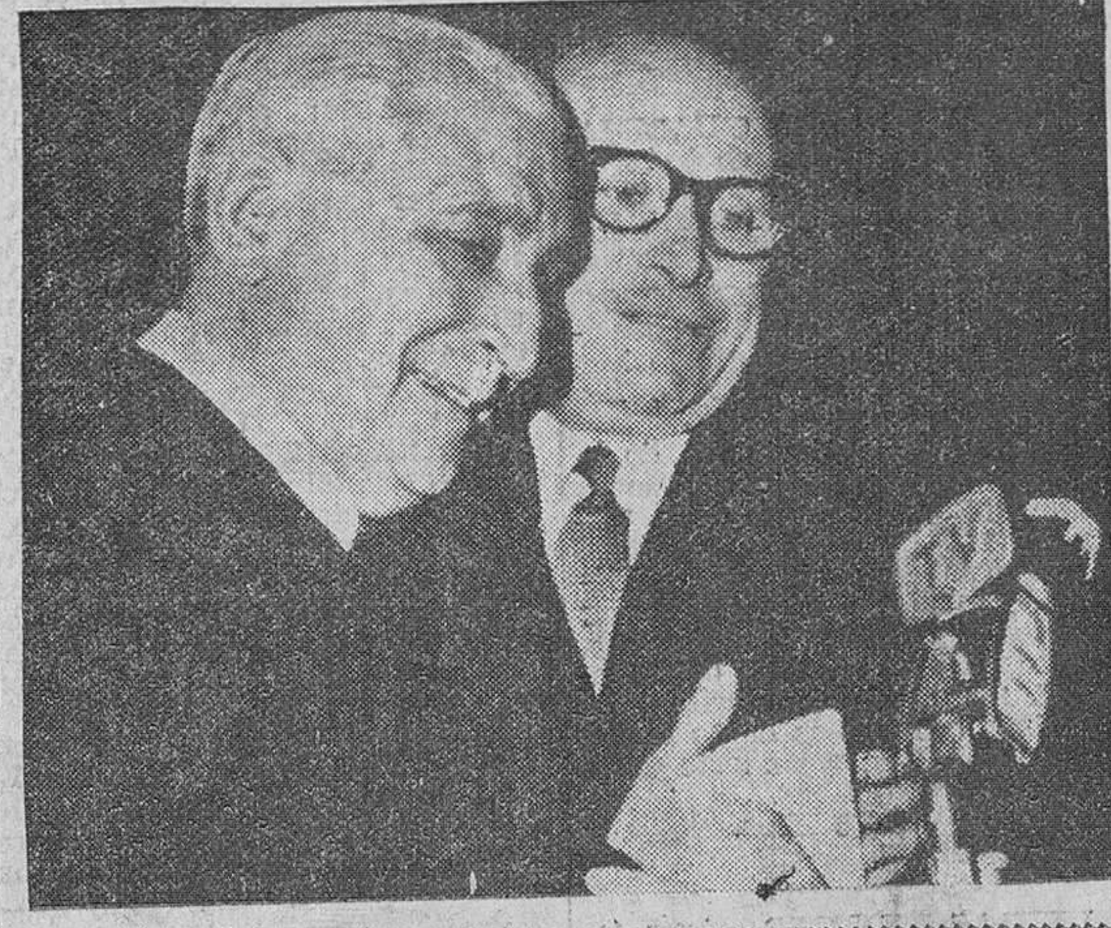
En Lisboa, con motivo del reconocimiento por parte del Tribunal Internacional de La Haya de los derechos de Portugal sobre sus posesiones de Asia, se celebró una gran manifestación patriótica que aclamó al presidente de la República y al Dr. Oliveira Salazar. A ambos les vemos en la foto que recoge el abrazo del jefe del Estado portugués a su jefe de Gobierno.

Herter informará mañana al Senado de los planes de EE. UU. respecto a la conferencia cumbre