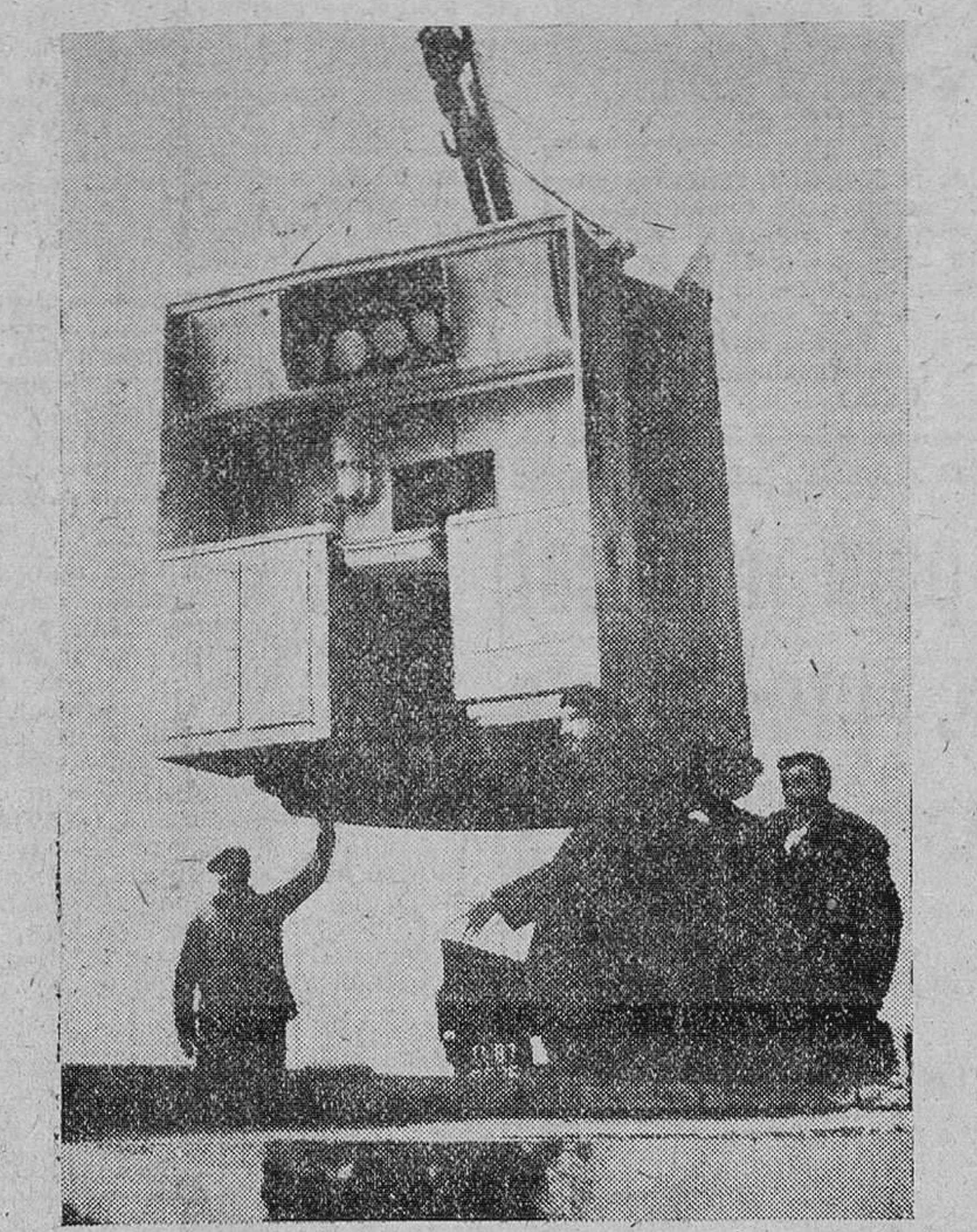
Paris. — El abate Pierre dirigiendo el emplazamiento de una casa prefabricada, con destino a una familia que carecía de hogar en el muelle de Alejandro III. Dicha casa, cuyo coste se eleva a 1.500 libras esterlinas, consta de una sala de estar, dos alcobas, cocina y cuarto de baño y puede ser emplazada en un día por cuatro operarios.