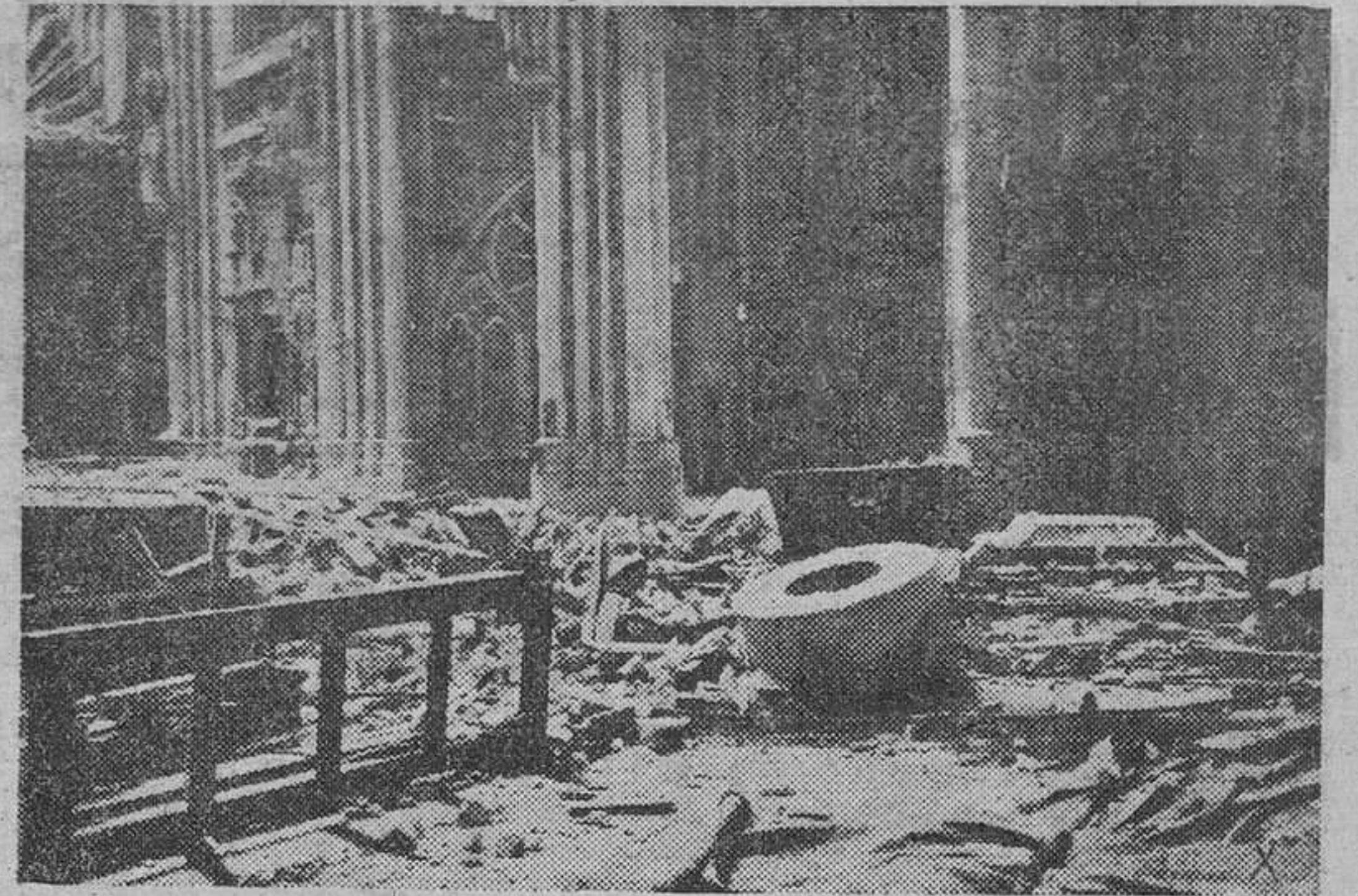
He aquí un documento gráfico de los destrozos causados recientemente por los bombarderos aliados en la Catedral de Colonia