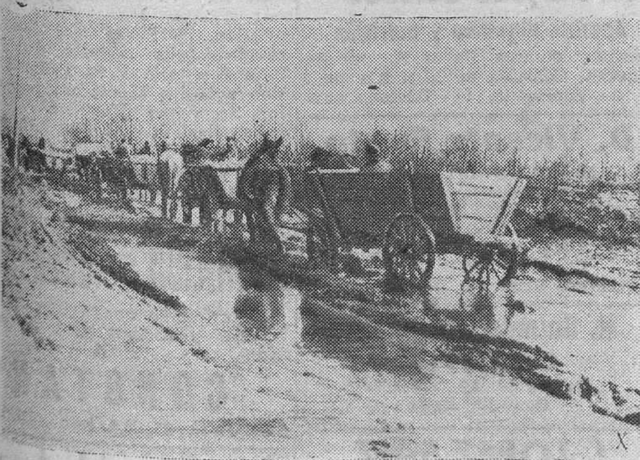
Las recientes lluvias han convertido las carreteras del frente Este en unos interminables lodazales. Aquí vemos a una columna de aprovisionamiento alemana salvando estos obstáculos para llegar a las líneas defensivas