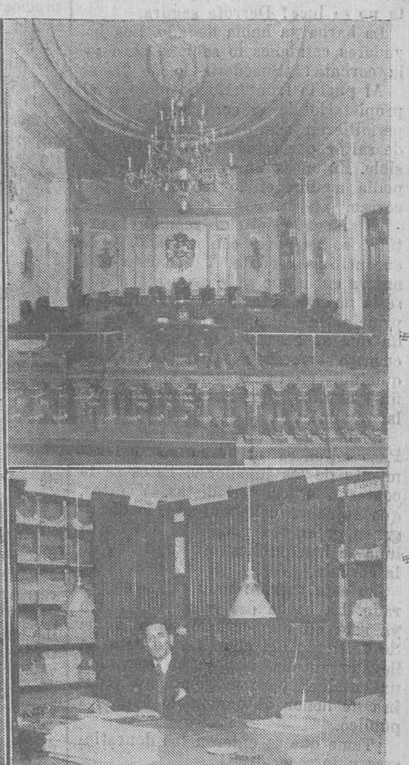
LAS REFORMAS EN LA AUDIENCIA.—DESPACHO DEL SEÑOR PRESIDENTE, SALA DE MAGISTRADOS, SALON DE ACTOS, DESPACHO DEL SEÑOR FISCAL, UN DETALLE DE LA ESCALERA PRINCIPAL Y UNO DE LOS DESPACHOS DE OFICINAS.