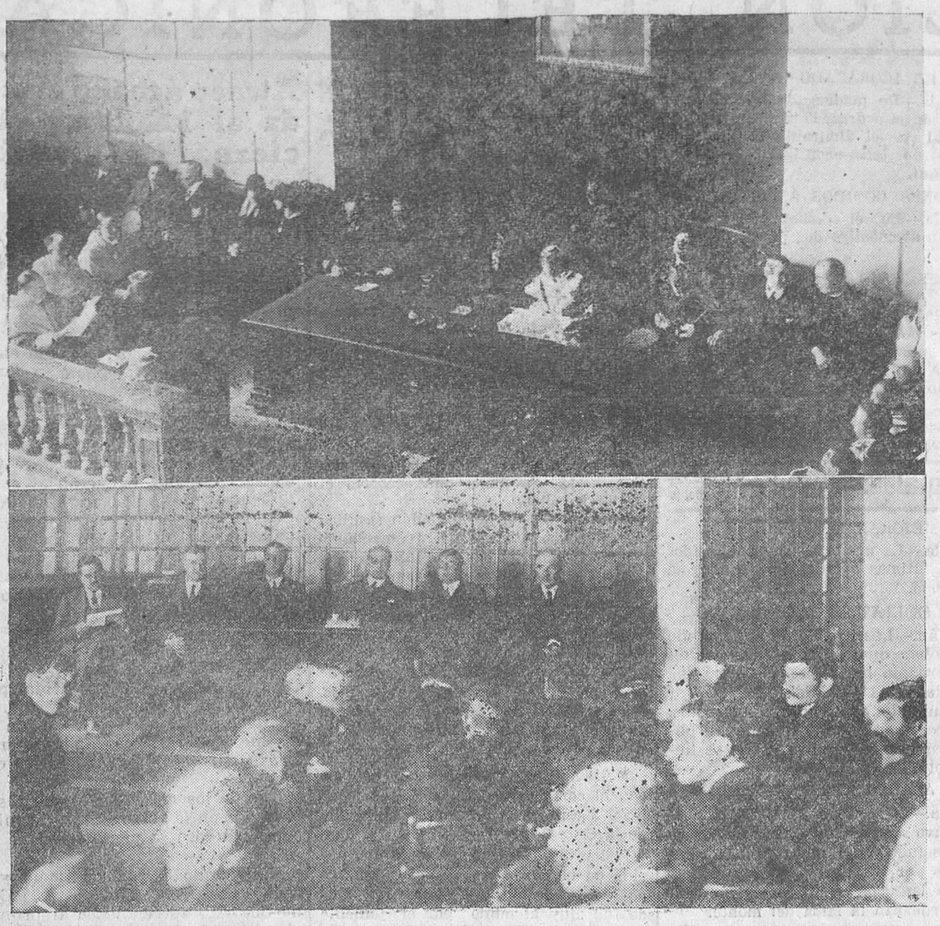
1. El Claustro y las autoridades que concurrieron al acto de apertura de curso en el Instituto General y Técnico.—2. La presidencia de la reunión celebrada ayer por los ganaderos de la provincia.