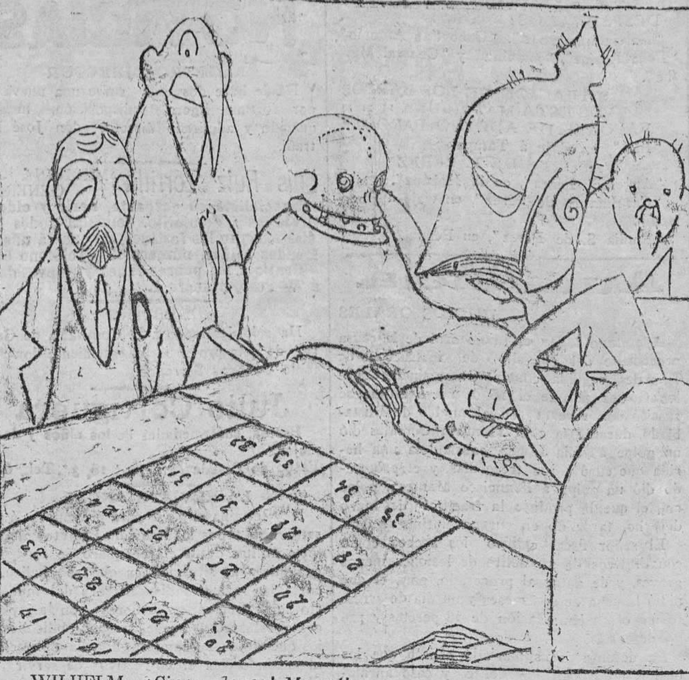
WILHELM.—¡Cinco plenos! Me retiro. GEORGE.—Aguarde, aguarde el amigo, que acabemos la partida. (Caricatura de BAGARIA)