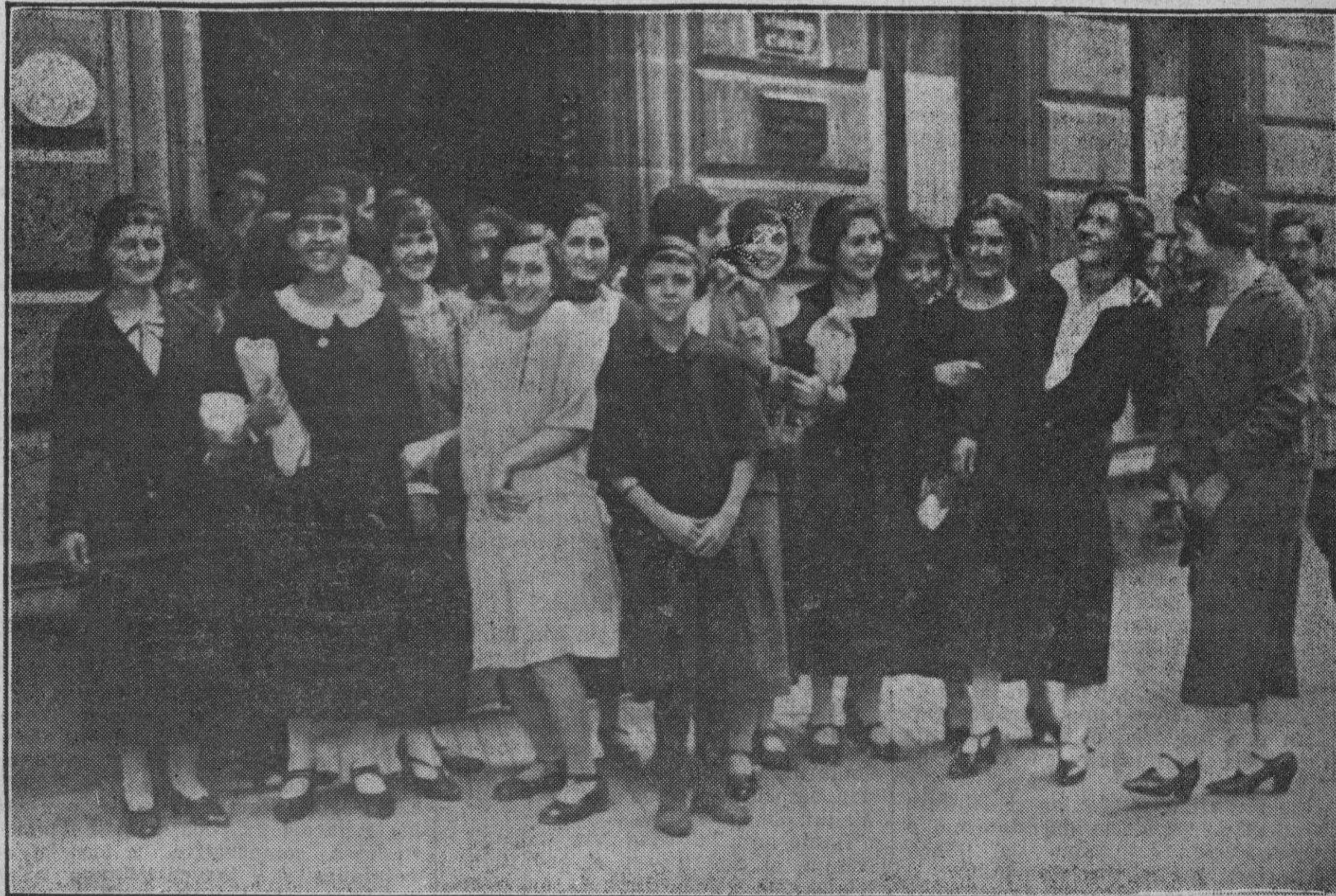
UNA SALIDA DEL TALLER DE RUFINA, QUE NUESTRO REDACTOR FOTOGRAFO, SEÑOR ALONSO, HA SORPRENDIDO

dejaran de dar sombra al recuerdo de sus muertos.