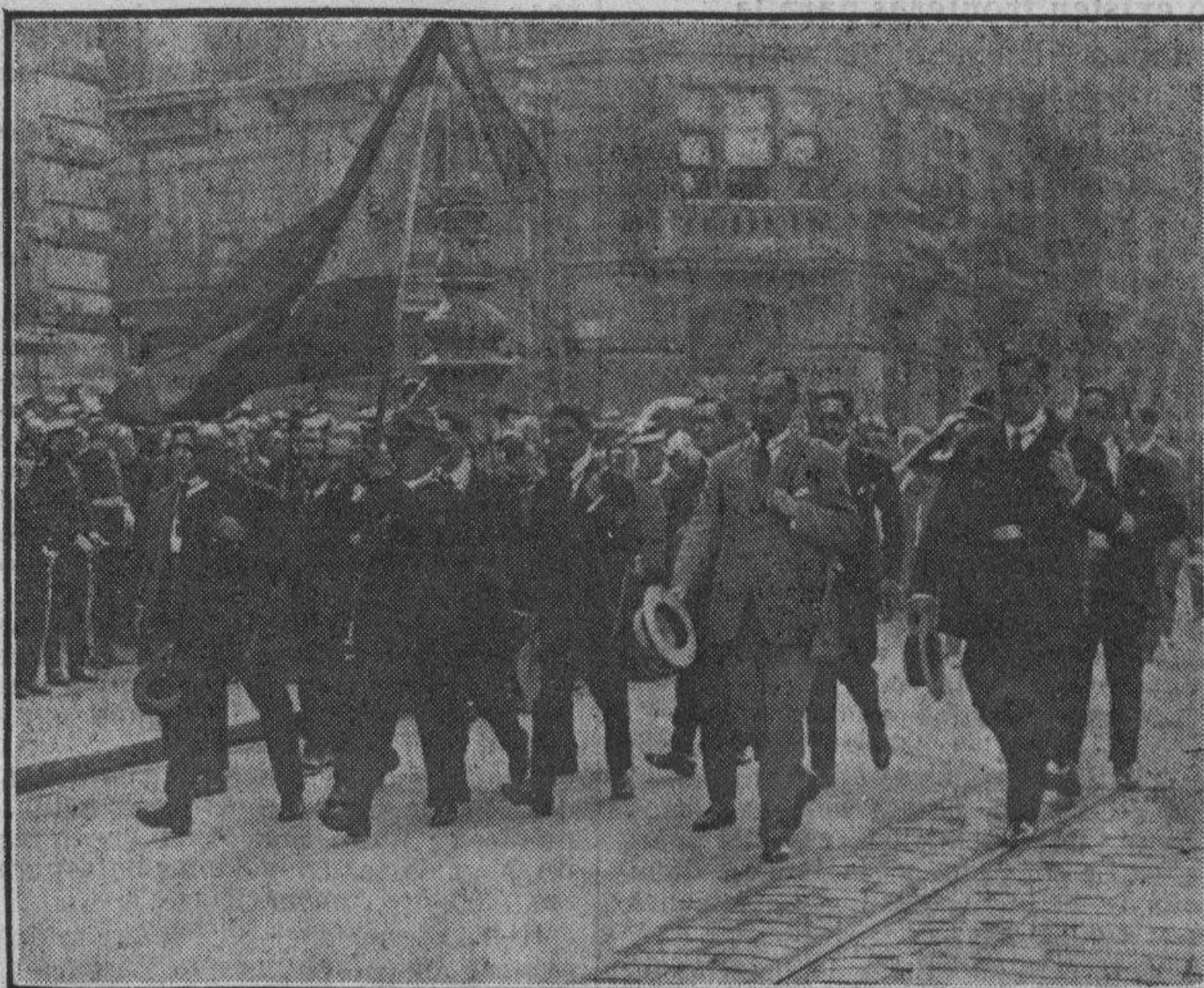
UN GRUPO DE LOS MAS DISTINGUIDOS Y BIZARROS