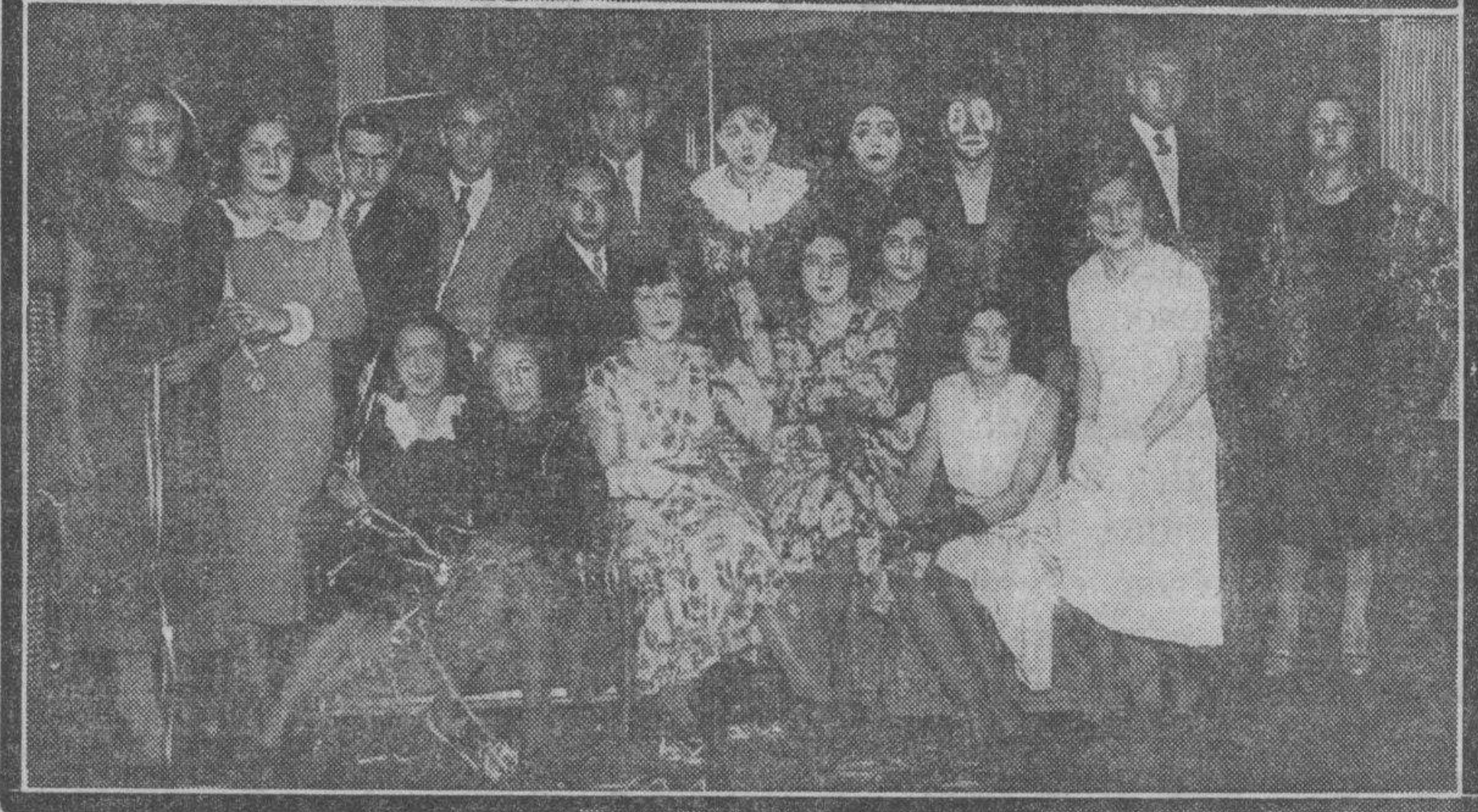
Los aspectos del tédanzant que, organizado por los estudiantes, se celebró el domingo de Piñata en el Gran Hotel.