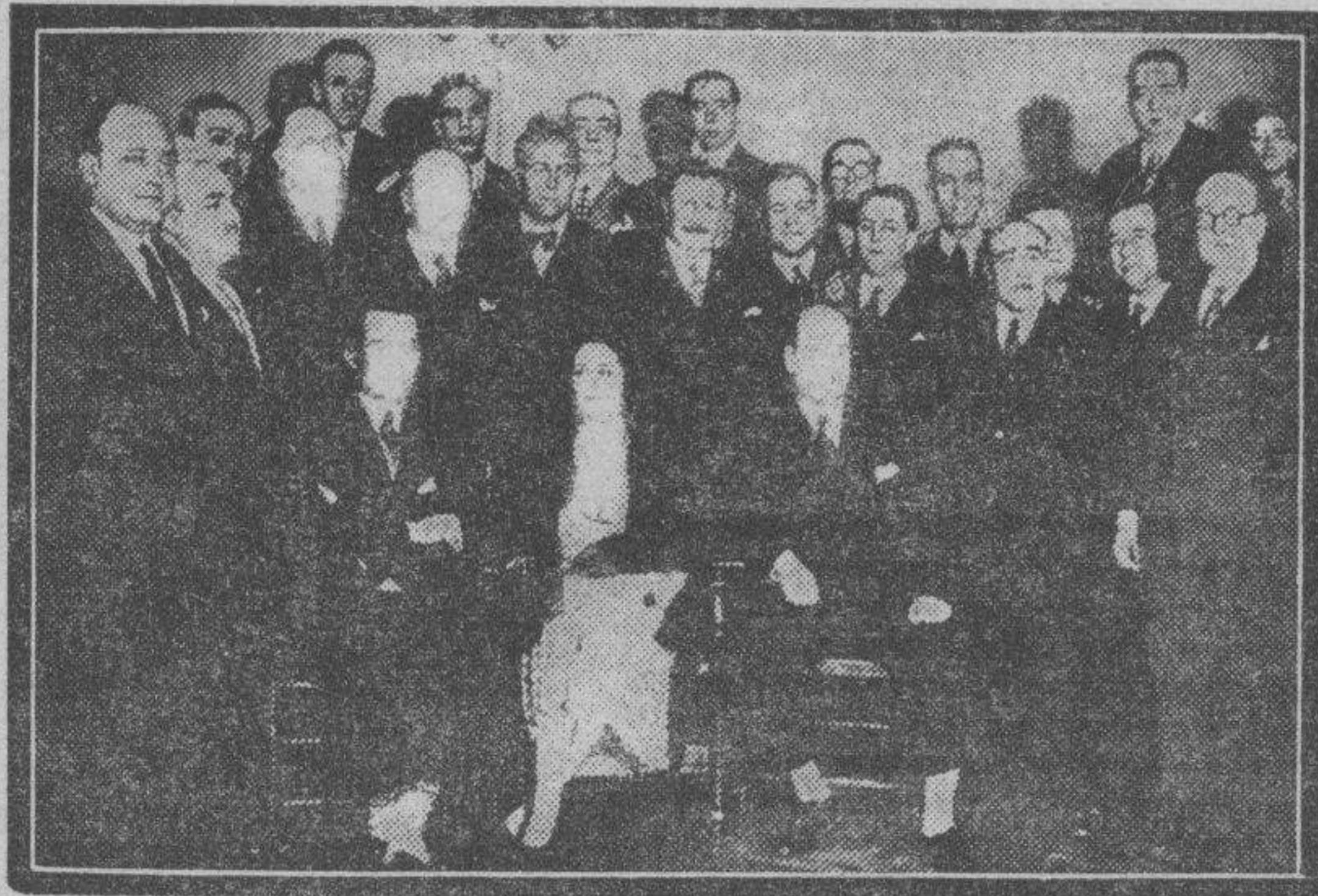
MADRID. — Se ha celebrado la inauguración del Centro Andaluz, acto al que han asistido, entre otras personalidades, la actriz Carmen Díaz y los comediógrafos hermanos Alvarez Quintero.

En Teruel ha producido la noticia de paralización de las obras de este ferrocarril verdadera inquietud.—CA-NO JARQUE.