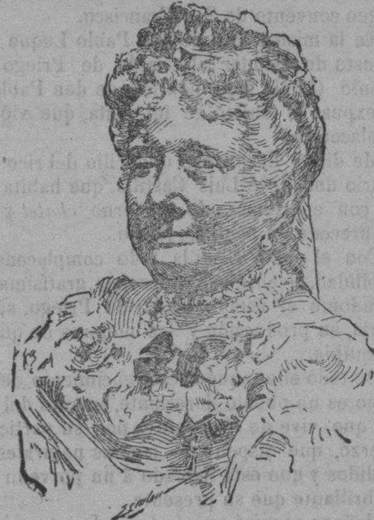
S. A. la Infanta Isabel, presidenta general efectiva.